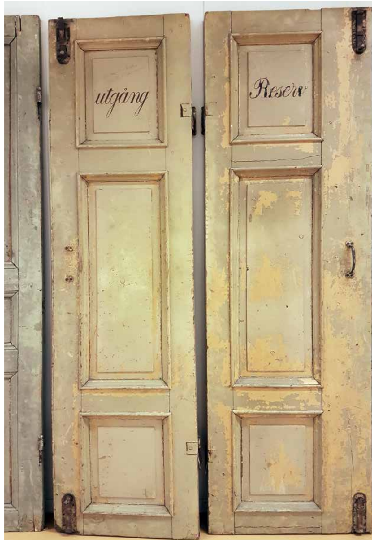
Några av alla de dörrar som ingår i föremålsförväret från Uppsala Teater.