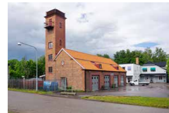
Gamla brandstationen berättar om Hebys historia som tegelmetropol. Den är ett viktigt minnesmärke över en svunnen epok.

På uppdrag av kommunerna genomför museet kulturhistoriska utredningar. Det kan vara inför exploateringar, bebyggelseomvandlingar och andra åtgärder, och bidrar till att kommunerna kan säkerställa att kulturhistoriska aspekter i planarbeten beaktas. På uppdrag av Östhammars kommun har museet gjort en utredning av kulturhistoriskt värde för kulturfastigheter i kommunens ägo. I samverkan med Uppsala kommun har museet genomfört en kulturhistorisk klassificering av byggnader inom utpekade områden. Inom Uppsala stad har även en inventering och värdering av byggnader och miljöer längs tänkta spårvägssträckningar mot den planerade Södra staden genomförts. Under 2020 har kulturhistoriska utredningar gjorts inför detaljplaner i flera områden inom Uppsala stad, och inom Knivsta kommun en utredning av kul-