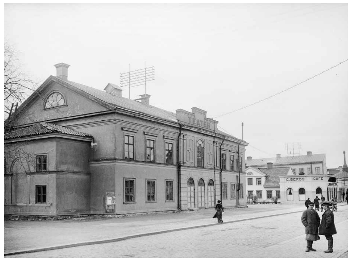
Uppsala teater, Château Barowiak, kvarteret Frigg, Vaksalagatan, Uppsala (AD322). 1901–1902.

Under 2020 utökades samlingarna med både bild- och föremålsmaterial, både enstaka föremål i form av gåvor och arkeologiska fyndmaterial. Efter beslut från Riksantikvarieämbetet fyndfördelades under 2020 material från sex arkeologiska undersökningar till Upplandsmuseet. Undersökningarna har utförts under åren 2013–2020.