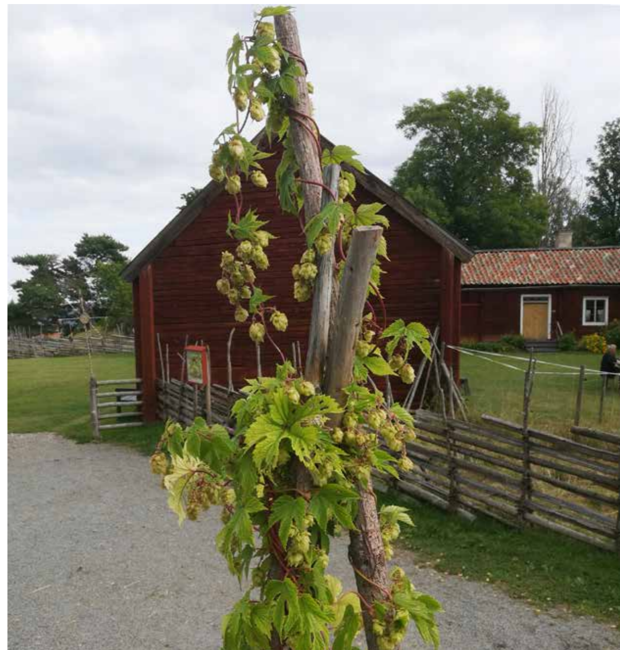
Disagårdens nya entré har kompletterats med ett antal bumlestörrar, med planter av gammal sort.

Vid mer komplicerade ändringar av lagskyddad bebyggelse krävs antikvariska kontrollbesiktningar. Upplandsmuseet har under 2020 skrivit antikvariska konsekvensbeskrivningar för flera kulturhistoriskt värdefulla miljöer och byggnader, bland annat inför restaurering av VVS-installationerna på Viks slott, inför nedläggande av kraftkabel i Engelska parken i Söderfors bruk och inför uppsättande av antenner på Teliahuset i Uppsala. En konsekvensanalys har utförts i samband med planerad fasadändring och om- och tillbyggnad i byggnaderna på Söderfors herrgård. Upplandsmuseet har tjänstgjort som sakkunnig kontrollant av kulturvärden vid om- och tillbyggnad av Stadshuset samt en uthuslänga vid Walmstedtska gården i Uppsala. En förutsättning för dessa uppdrag är att bebyggelseantikvarierna är certifierade.