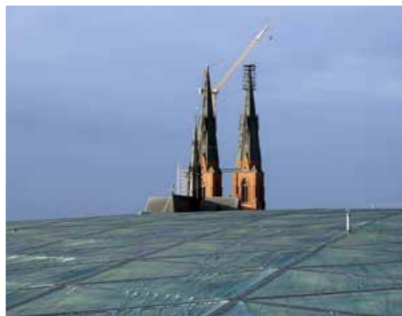
Det nya kupoltaket på Uppsala stadshuset. Upplandsmuseet är sakkunnig kontrollant av kulturvärden vid ombyggnaden av stadshuset.

En viktig fastighetsägare ur kulturhistorisk synvinkel är församlingar inom Svenska kyrkan, till vilka museet erbjuder rådgivning inför ombyggnationer och renoveringar. Museet har under året haft ett flertal uppdrag som antikvarisk expert vid åtgärder på kyrkomiljöer. För Åkerby kyrka har museet gjort en byggnadshistorisk utredning av dess interiör, i syfte att skapa ett underlag för en planerad ny omgestaltning. I Tensta kyrka har pastoratet ordnat tillgänglighet till de fantastiska kyrkvindarna med takstolar från 1300-talet, från tiden innan kyrkan fick sina tegelvalv. Liknande tillgänglighetsåtgärder ska göras på vinden till vapenhuset i Årentuna kyrka, och museet har utfört en kulturhistorisk konsekvensanalys av de planerade åtgärderna. Då konservatorsåtgärder gjordes i Vasagraven i Uppsala domkyrka deltog museet med kulturhistorisk expertis, och i samband med omläggning av täckhällen gjordes en översyn av kistor och puts, samt klimat. Museet har även medverkat i det fortlöpande arbetet med Faderns fönster i Domkyrkan. Andra projekt där museet