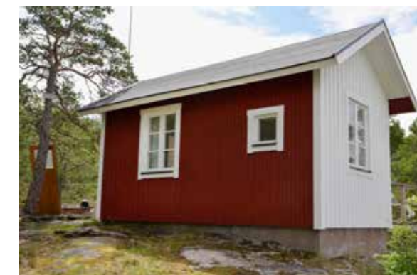
Den tidigare lotsutkiken i naturreservatet Källarberget i Hällnäs har renoverats. Upplandsmuseet deltog som antikvarisk expert.

turhistoriska värden hos landskap och bebyggelse inom två större områden.