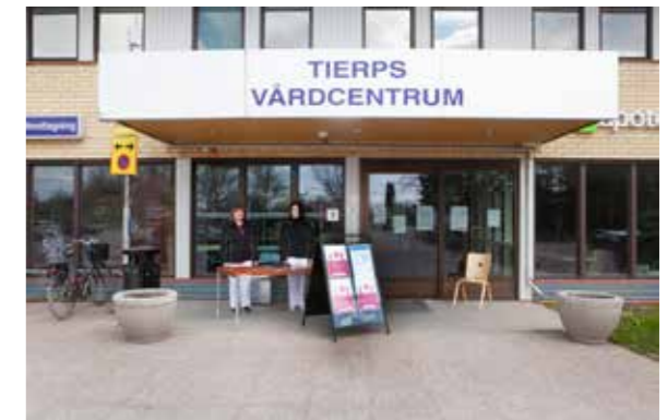
Tierps vårdcentral tar emot besökare. Foto Olle Norling.

Rapporten Lantbrukare och icke-bönder, jordbrukets förändring i en uppföljande undersökning av tre uppländska gårdar , av Martina Nilsson utkom i början av 2020. Där speglas den förändring som skett med strukturrationaliseringar, jordbrukets digitalisering och individers ökade krav på fritid liksom klyftan mellan stad och land, att leva på landsbygden, miljöfrågor liksom framtiden för det