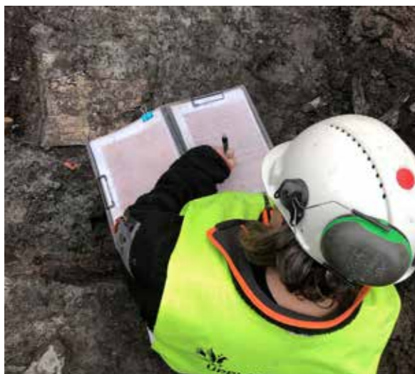
Dokumentation av välbevarad medeltid på S:t Johannesgatan i Uppsala. Foto Anna Ölund.