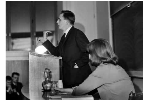
Verdandi – debatt om studiestöd, Uppsala universitet, Olof Palme och Birgitta Dahl. Foto Uppsala-Bild 1964.

Tidigt under året uppmärksammades de kulturhistoriskt intressanta kabinetsfotografierna, dels genom en serie radioinslag på P4 Uppland, dels på grund av behovet att hitta lämpliga arbetsuppgifter för att följa uppmaningen om hemarbete. Kabinetsfotografiet, eller visitkortet som de också kallas, består av en bild som är uppklistrat på en bit kartong med storlek ca 6x9 cm och användes som namnet avslöjar från början som just visitkort. Med tiden övergick de till att bli samlarobjekt som