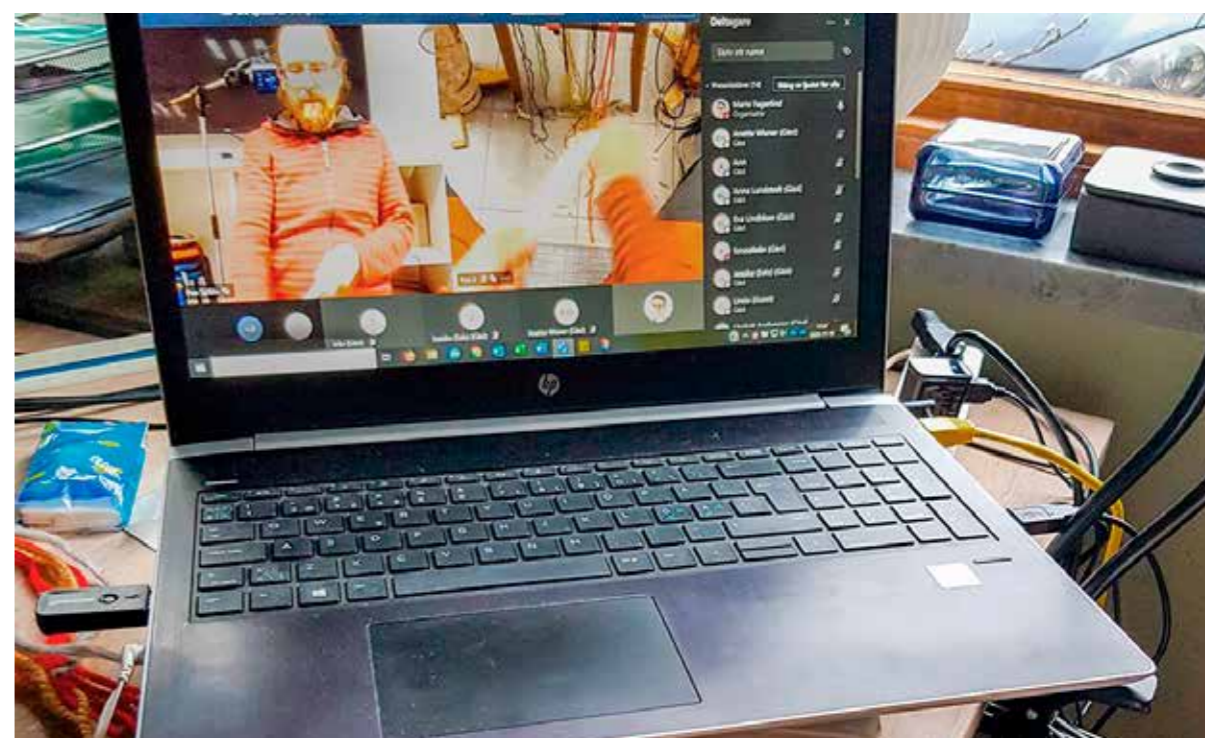
Slöjd genom digitala kanaler när vi inte kunde mötas fysiskt.

Exempel på samarbetspartners: Dalarna, Gävleborg, Sörmland, Västmanland, Värmland, Örebro och Stockholms län/regioner, Stiftelsen Österbybruks herrgård, Studieförbundet Vuxenskolan, lokala hantverksföreningar och företag.