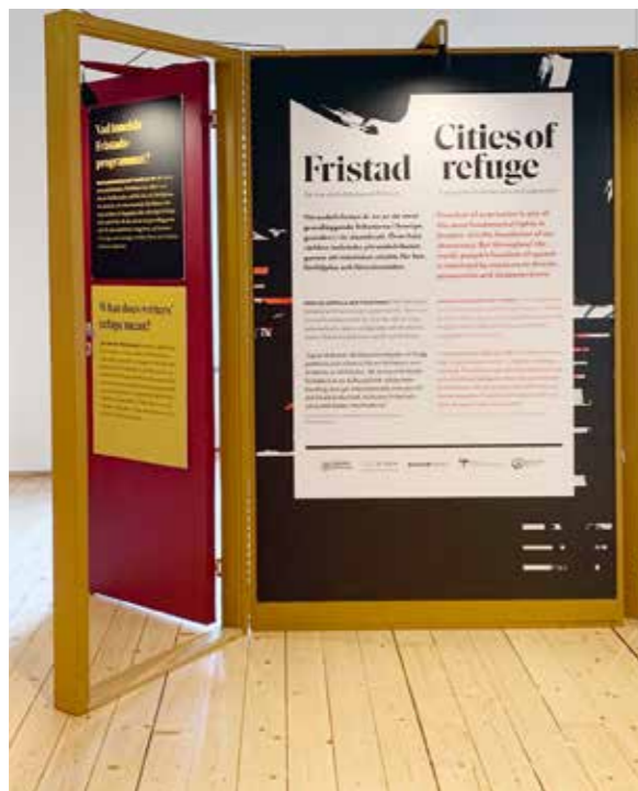
Till utställningen "Fristad – ett svar på förföljelse och förtryck" hölls några öppna visningar under hösten.