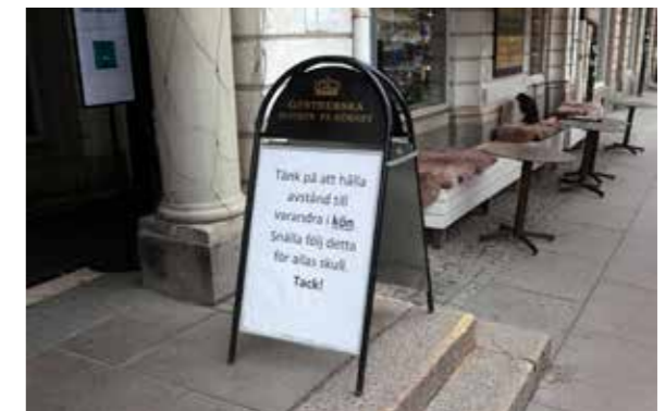
Skyttar vi blivit vana vid att se, Uppsala.