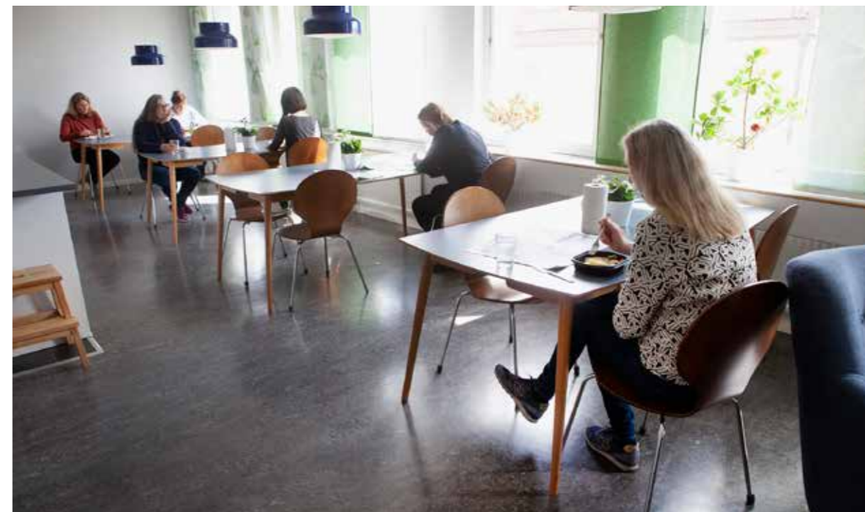
Upplandsmuseets lunchrum. Bild tagen i samband med dokumentationen "Ställa in – ställa om".

Programverksamheten kopplad till den tillfälliga utställningen I fotografiets tid – Resor i Sápmi an-