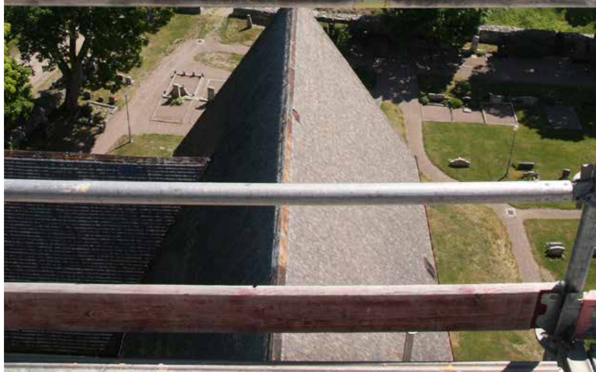
Skuttunge kyrkas fasadrenovering omfattade hela fasaden inklusive tornet och dess lanternin. Ett riktigt höjdararbete!