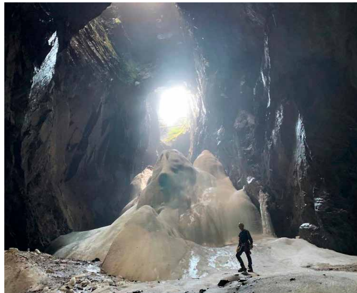
Ismassor i Silbergsgruvan i Dannemora. På 1840-talet byggdes trätak för grubbålen för att undvika isbildning. Idag finns planer på att anlägga klätterled, vilket kräver att resterna av takkonstruktionerna tas bort. Museet har dokumenterat och värderat konstruktionerna.

Arkeologerna på museet har löpande under 2020 arbetat med analyser, fyndomhändertagande och avrapportering av genomförda undersökningar. Under året färdigställdes 16 arkeologiska rapporter, se https://www.upplandsmuseet.se/publikationer/rapportserien/rapporter-2020/ .