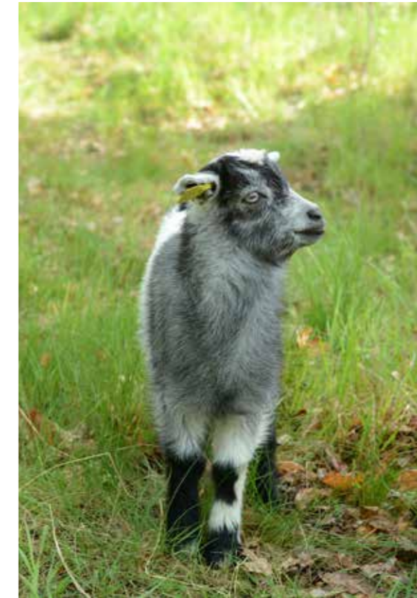
Disagårdens nya lantras, Jämtget. Förutom att glädja besökare hjälpte de till med att rensa sly.

Upplandsmuseets föremålsmagasin ligger i Morgongåva. Där pågår daglig verksamhet i form av vård, skanning och registrering av Upplandsmuseets samlingar. I magasinet tas besökare och grupper emot för olika typer av visningar. Under året har vi, precis som många andra fått ställa in och ställa om. Besökare kunde rent fysiskt inte tas emot i magasinet, bokade visningar och föredrag