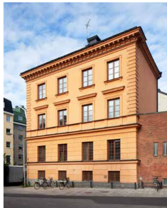
Klostergatan 2. Kungl. Gustav Adolf Akademiens byggnad i Uppsala.