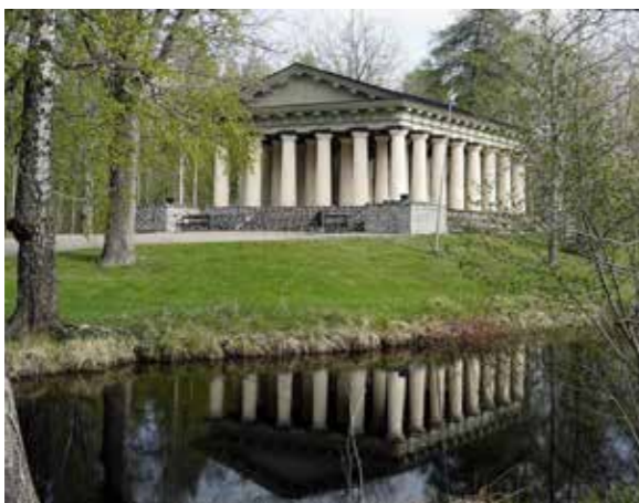
Det grekiska templet i Engelska parken i Söderfors står stadigt på sin bas av slaggsten. Åtgärder på grusvägarna i parken har övervakats av museets antikvarie.

med antikvarisk expertis har varit vid restaurering av ekonomibyggnad på Schramska gården i Östhammar, omläggning av tak på smedsbostad i Lövestabruk och återställande av interiören i västra flygeln och åtgärder i trädgården inom byggnadsminnet Linnés Sävja. Ytterligare projekt har varit omläggning av tegeltak på Bränneriet vid Grönsö slott, renovering av stenladugård i Sparsätra och ett gruvarbetartorp i Dannemora.