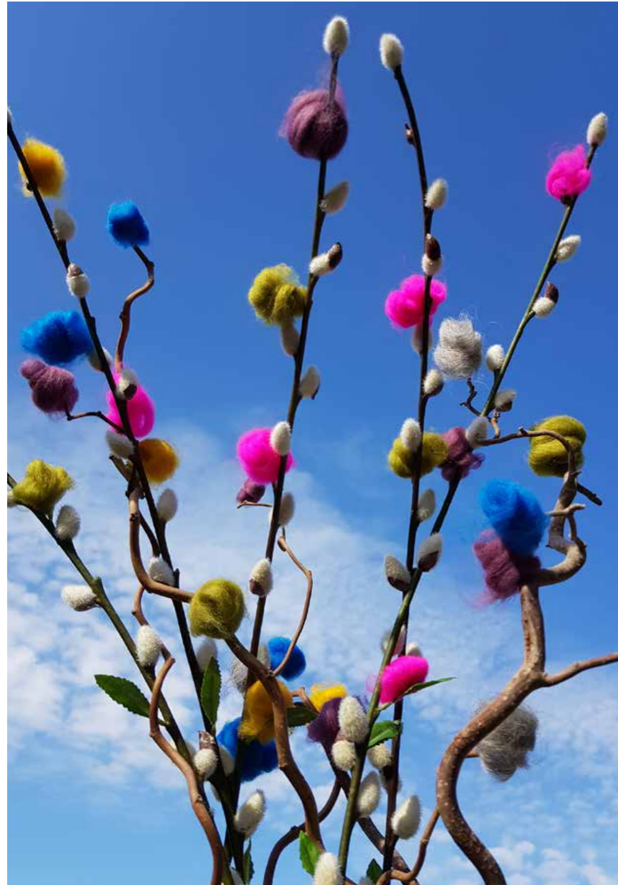
Påskris med ulltassar, tillverkat i samarbete med Almunge och Magelungens skolor, inom projektet "Slöjd Håller!".