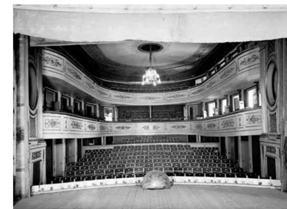
Salongen i Uppsala teater, Château Barowiak, kvarteret Frigg, Uppsala (AS06540). 1937.

Ett av de större föremålsintagen, utöver de arkeologiska materialen, utgörs av delar av inredningen, viss dekor, takkrona, innerdörrar, läktarbarriärer och scen-maskinerier, till den numera rivna byggnaden Uppsala (gamla) Teater också benämnd som Château Barowiak. Teaterbyggnaden låg vid Vaksalagatan där det nuvarande Stadshuset är beläget. Teatern byggdes 1841, togs i bruk samma år