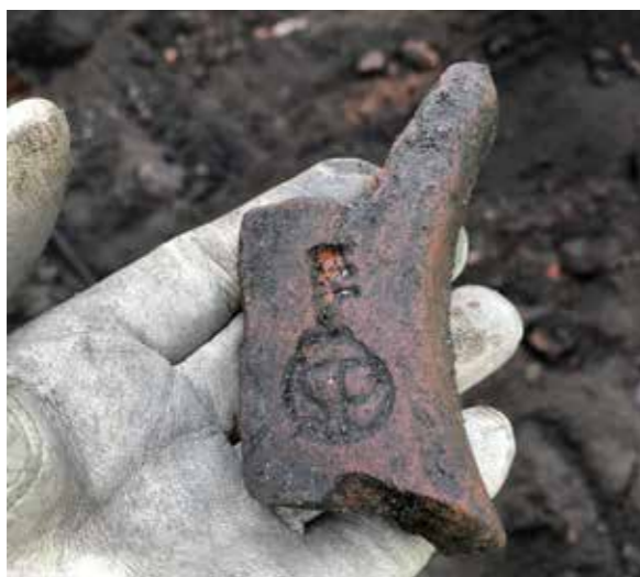
S:t Petri nyckel kallas denna stämpel som visar att takteglat tillverkades i Lübeck mellan 1649–1759. Tegelbiten är hittad vid Snerikes nation i Uppsala.

passerar fornlämning har Upplandsmuseets arkeologer övervakat markarbetet. Det har inneburit många arbetsdagar vid smala schakt bland annat i områden kring Hagby, Grillby och Tierps kyrkby. Arbetet har resulterat i ett flertal nyupptäckta fornlämningar, samt kunskap om befintliga lämningars utbredning, karaktär och dateringar, vilket bidrar med kunskap kring länets förhistoria. Under hösten gjordes också en stor förundersökning vid Ekeby i Bälinge. Resultaten visar på en intensiv bosättning från järnålder med närliggande gravfält. I Uppland som är ett av landets fornlämningstätaste landskap innebär exploateringar många gånger arkeologiska insatser i någon form. För riksväg 55, mellan Uppsala och Enköping finns ett behov av ökad trafiksäkerhet vilket gör att vägen inom vissa sträckor kommer att byggas om. Museets arkeologer har inventerat sträckor utmed vägen för att identifiera de lämningar som kan komma att beröras av vägbygget. Här hittades bland annat boplatslägen, gravar samt historisk bebyggelse som inte tidigare uppmärksammats.