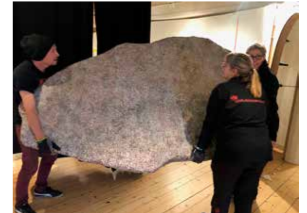
Arbete pågår inför runstensutställningen.

I basutställningen Vårt Uppsala behandlas viktiga händelser, personer och byggnader i Uppsala