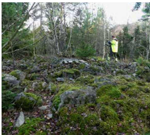
En nyupptäckt grav från järnåldern dokumenteras invid riksväg 55.