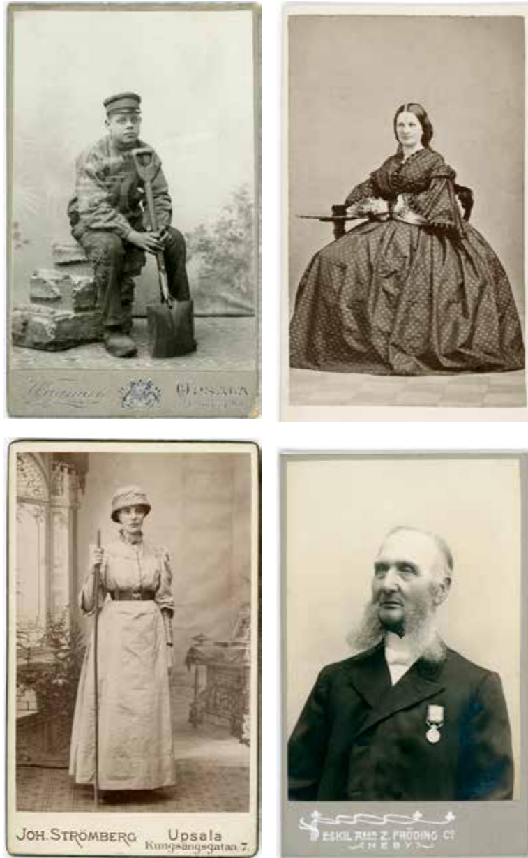
Några av de kabinetsfotografier som finns i museets samlingar (FN03807, FN03823, FN04150 och FN04254) och som nu registrerats och tillgängliggjorts. Fotografierna har kommit in till museet främst som gåvor, av flera olika personer och under lång tid.