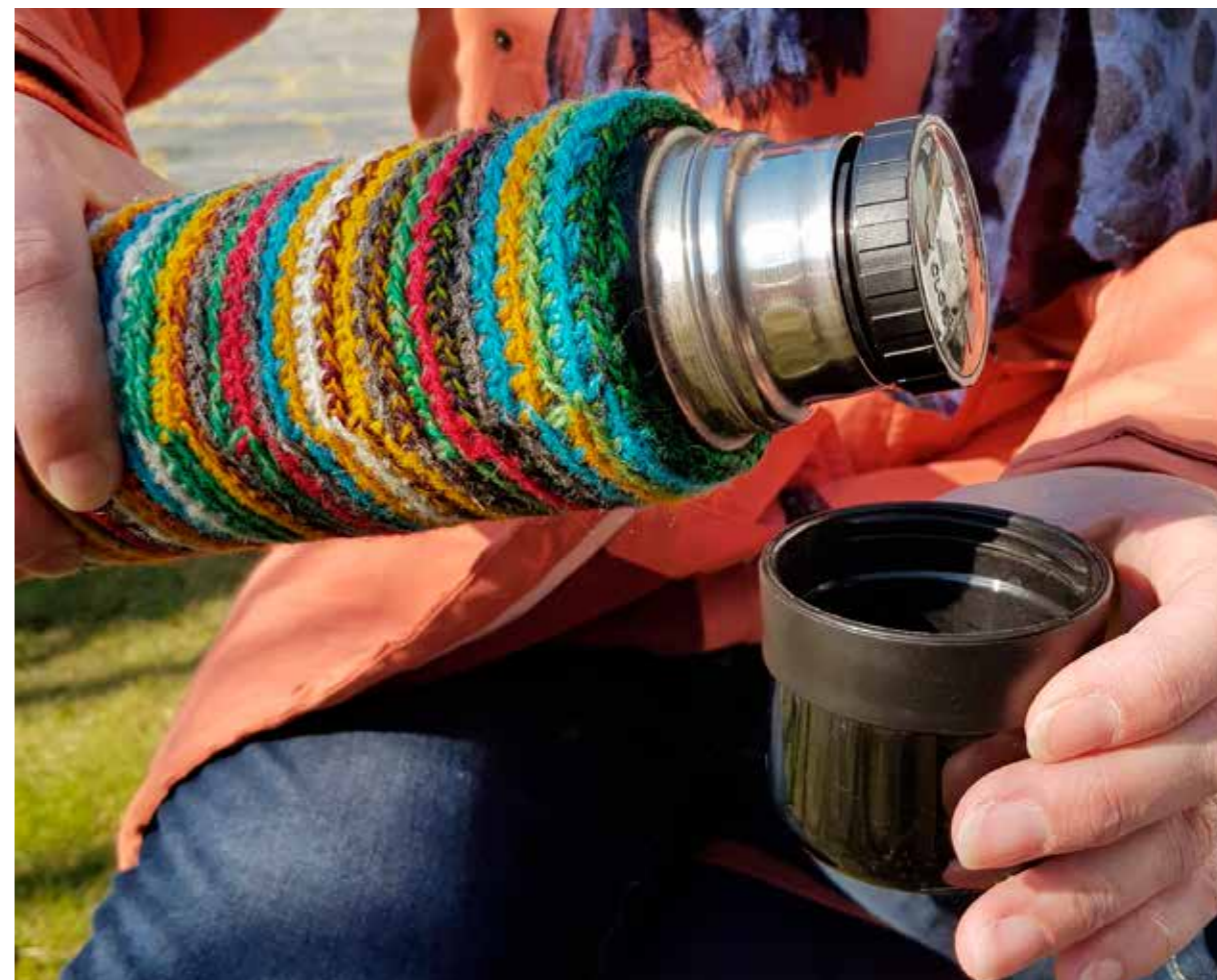
Slöjdtips i Coronatider. Under året fick allmänheten en mängd slöjdtips från museets bemsjöds-konsulenter. Här ett vackert och värmande termoskydd.

Museigården och byggnadsminnet Kvekgården i Stora Kveks by utanför Örsundsbro ägs av Upplands fornminnesförening och hembygdsförbund. Anläggningens status som byggnadsminne kräver hög trovärdighet i utförande samt i val av traditionella material vid fortlöpande åtgärder på byggnaderna. Upplandsmuseum ansvarar för byggnadsvård