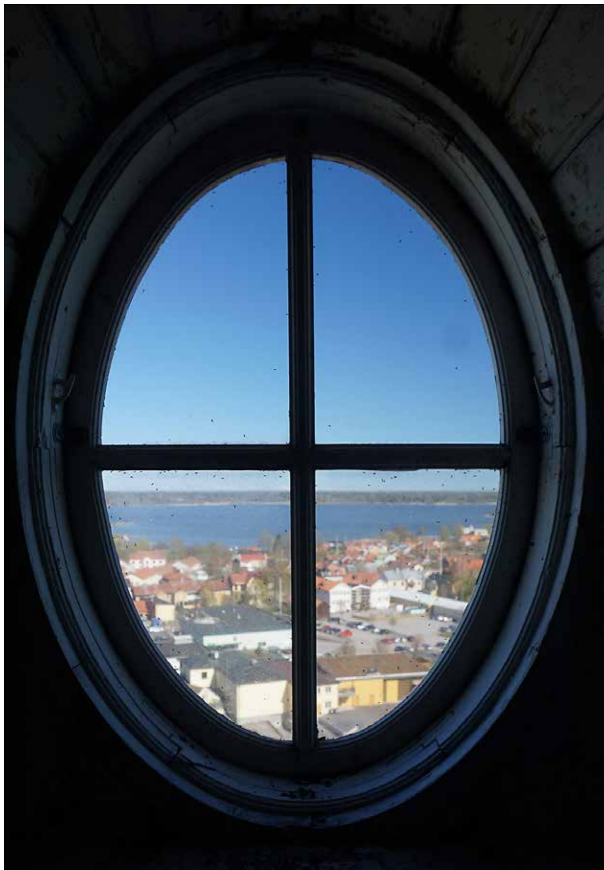
Gamla vattentornet i Östhammar tronar på en höjd intill stadskärnan. Det är en av Östbammars kommuns kulturfastigheter, dvs kulturbistoriskt värdefulla miljöer som ägs av kommunen. Upplandsmuseet har gjort antikvariska värderingar av dessa, som hjälper den fortsatta förvaltningen.