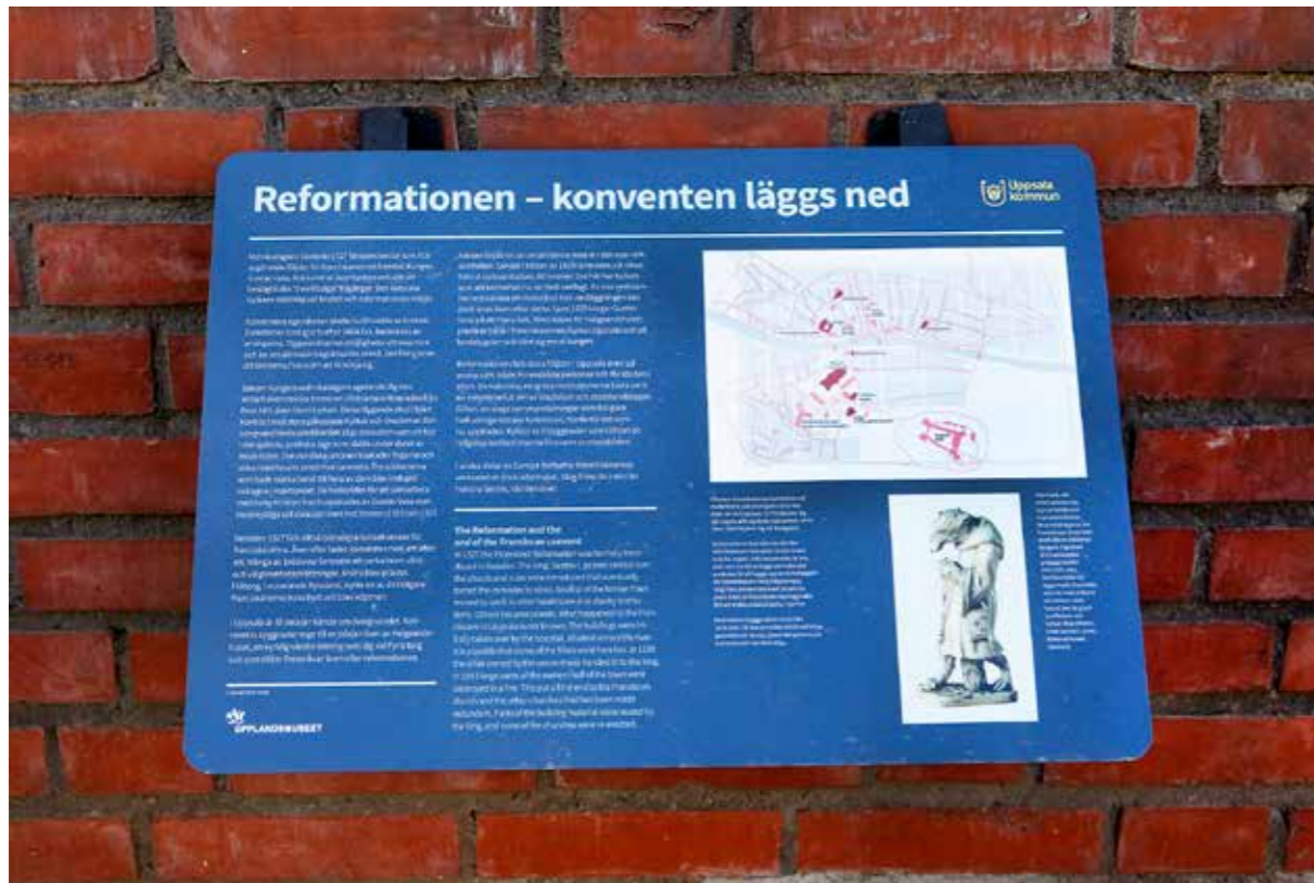
En av informationsskyltarna vid Klosterparken.

Klostergatan 2 , ett forskningsprojekt som drivs i samarbete mellan museet och Kungl. Gustav Adolfs Akademien, har väsentligt ökat kunskapen om stenhuset på Klostergatan 2 i Uppsala och stadsgården som den ingått i, en grannbyggnad belägen direkt invid franciskankonventets område. Arkivmaterial, tänkeböcker och ägarlängd som kunnat rekonstrueras från slutet av 1400-talet, tillsammans med byggnadens historia, belyser området på östra sidan om ån över tid. Publikationen som bekostades av akademien utkom 2020.