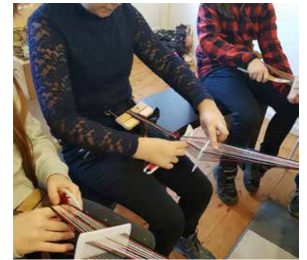
Löslöjd med samiskt tema kopplat till utställningen "I fotografiets tid – Resor i Sápmi".

I slöjdverksamhet riktad till barn och unga sker arbetet både på praktiskt och strategiskt plan. Vi strävar efter att så många som möjligt i målgruppen ska känna till och ha tillgång till hemslöjd