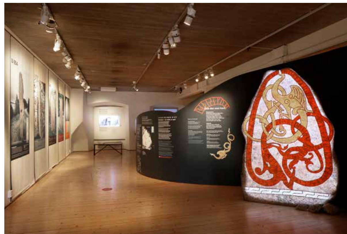
Tyde den som kan – en bred och innehållsrik utställning och introduktion till runorna och runstenarnas värld.

Den uppskattade utställningen om gravskick, gravvårdar och vårt sätt att närma oss döden, har under året färdigställts som vandringsvariant. I smidigt och stilrent utförande visas den enkelt på museer, i bibliotek, kyrkor eller församlingsgårdar. Utställningen öppnade i Vadstena Klostermuseum den 1/11 2022.