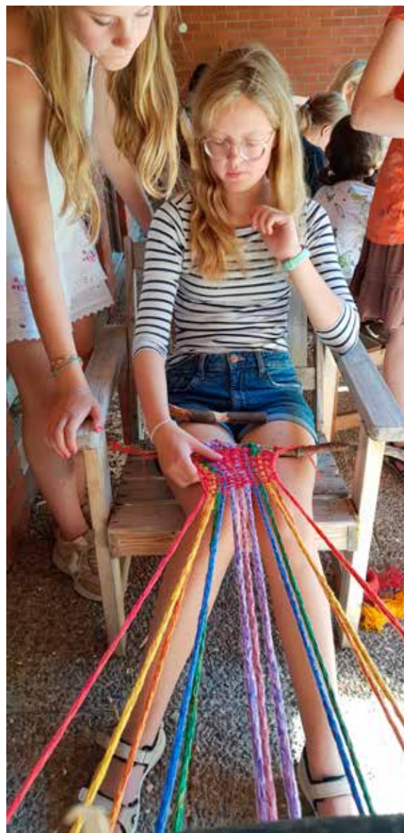
Kulturkollo Slöjd på Wiik augusti 2022.