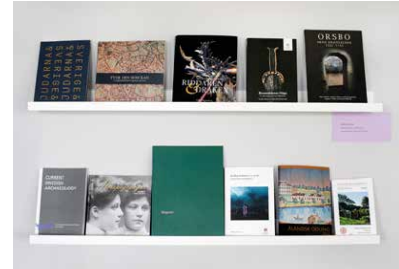
Hyllan för nyinkommen litteratur som tillförts Upplandsmuseets bibliotek. På övre raden står två av de böcker som medarbetare på museets forskningsavdelning utkommit med under året: Riddaren och draken och Tyde den som kan .

Projektet Fynd i fokus. Specialstudier: föremål och företeelser i Gamla Uppsala, Valsgärde och omlandet är ett samarbete med forskare vid det av Vetenskapsrådet stödda The Viking Phenomenon vid Uppsala universitet och ett flertal andra forskare inom och utom landet liksom medarbetare vid Upplandsmuseets arkeologiska avdelning. Analys-