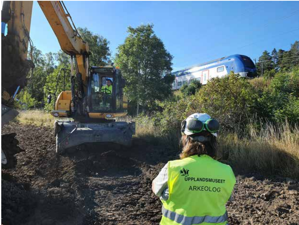
Arkeologisk utredning vid järnvägen i Bergsbrunna söder om Uppsala.

vilket gör att nedbrytningsprocesserna inte satt igång. Därför hittade vi stora mängder trä- och läderföremål som exempelvis träskålar och skor som ser nya ut, fast de är från 1300-talet.