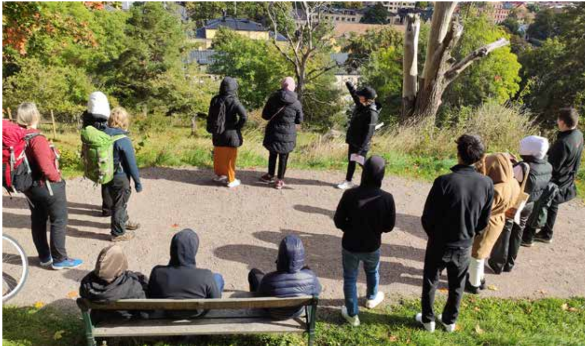
Gymnasieelever får en historisk introduktion till staden och ån, strax bredvid Uppsala slott.

gaklasser. Under helgerna har stugvärdar varit på plats i husen och mött besökarna. Under sommaren har Disagården haft två caféer drivna av två olika entreprenörer. Förutom ett mer traditionellt café har företaget Utefikat sålt mat och fika lagat på stekhäll. Flera besökare var nöjda med att utbudet var så stort.