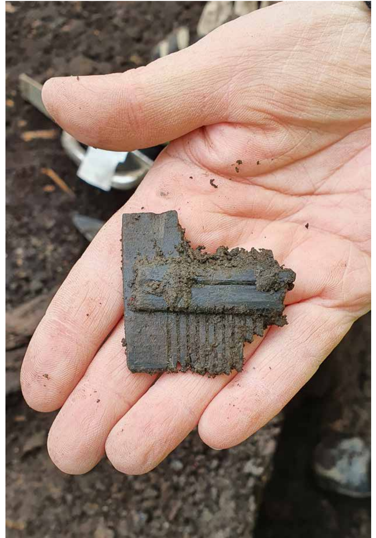
En medeltida kam, direkt från kulturlagren under Stora torget.

Väg 55 mellan Uppsala och Enköping är en hårt trafikerad sträcka som planeras att byggas om till en 2+1 väg. Inför eventuell ombyggnad har vi gjort