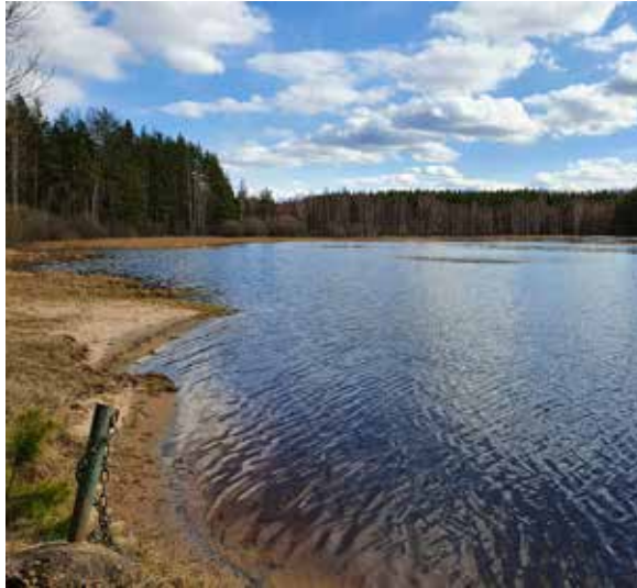
Vid Ingboviken i Nora sn (Tärnsjö) Uppland finns lämningar efter ett sockensamiskt torp.