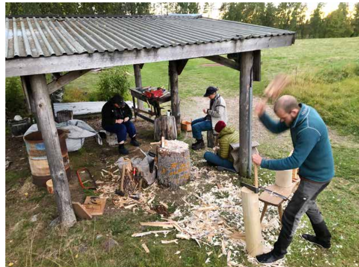
Slöjddresidens Fågelsjö.

Exempel på samarbetspartners: Svenska hemslöjdsföreningars riksförbund, regionala och lokala hemslöjdsföreningar, Nämnden för hemslöjdsfrågor, enskilda näringsverksamma slöjdare och företag samt nationellt samarbete med Dalarna, Gävleborg, Sörmland, Västmanland, Värmland, Örebro och Stockholms län/regioner.