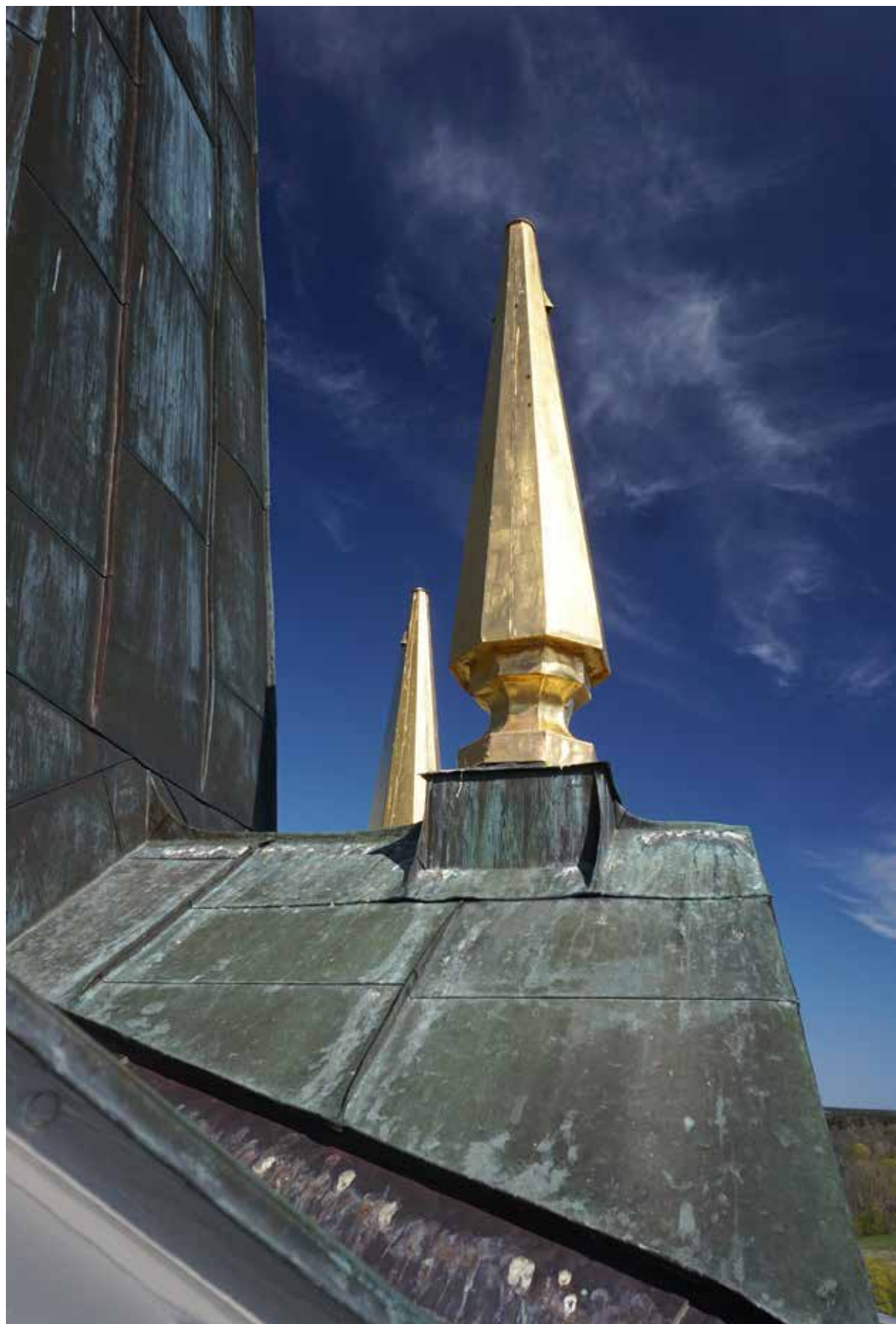
Torndryad på Västlands kyrka

har också möjlighet att beställa bilder. Upplandsmuseet sidor på DigitaltMuseum har under 2022 haft nästan 542 000 besök.