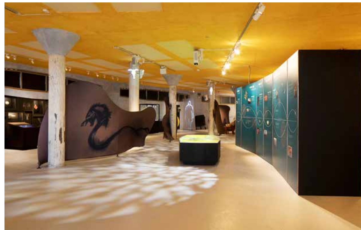
Gamla Uppsala museums nya utställning.

I den nya basutställningen finns en utbytbar del för att möjliggöra för tillfälliga utställningar. Nu i den första tillfälliga utställningen lyfts det forng Engelska eposet om Beowulf fram. Beowulfutställningen är gjord av No Parking i dialog med professor emeritus Bo Gräslund, som nyligen publicerat ny forskning om Beowulf, och vetenskapsjourna-