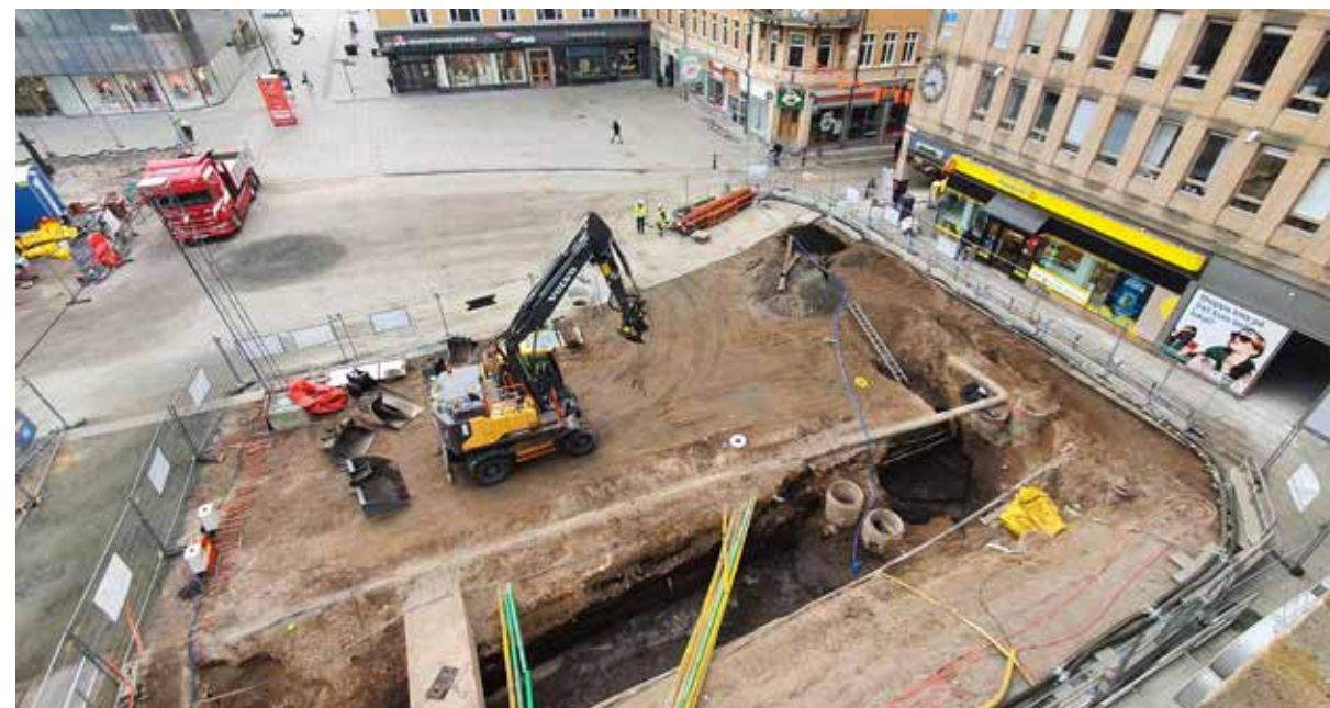
Under hela 2022 pågick en stor arkeologisk schaktningsövervakning på Stora torget i centrala Uppsala. Så här såg det ut under våren 2022.

ledningen (vice ordförande) för the International Sachsensymposium , en sammanslutning av arkeologer i västra, norra och mellersta Europa.