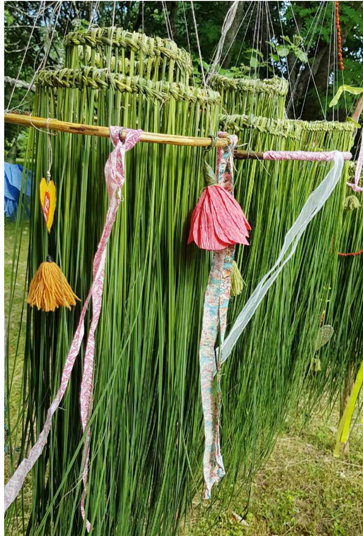
Kurs i tillverkning av gräskronor i samarbete med De Linneanska trädgårdarna 2022.