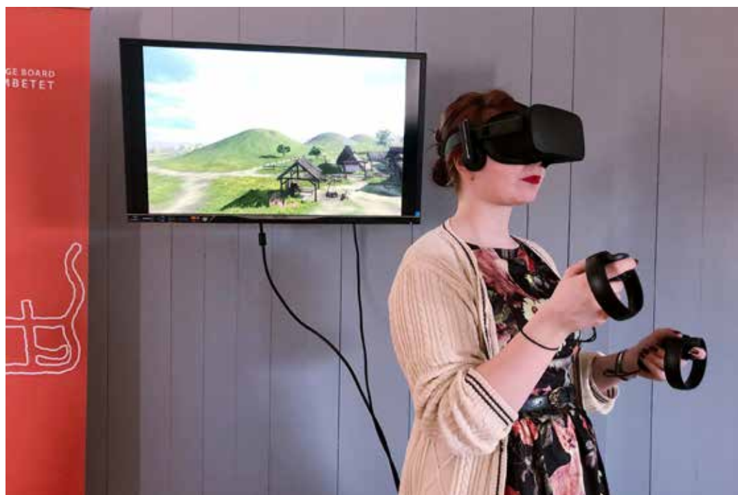
VR – Virtual Reality, ett nytt sätt att uppleva gamla tider och miljöer; här ett besök i vändetidens Gamla Uppsala