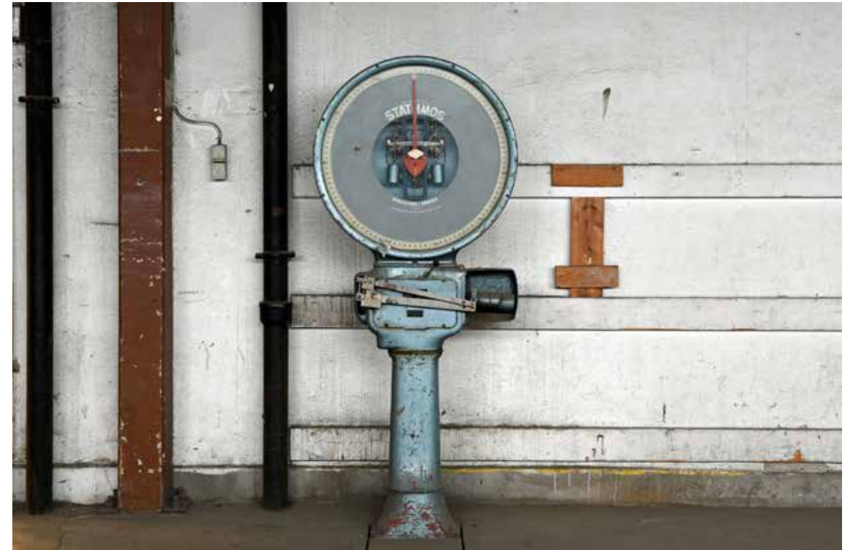
Våg för ett ton i källaren till trädgårdscentralens byggnad i kvarteret Ställverket i Uppsala.

En viktig fastighetsägare ur kulturhistorisk synvinkel är församlingar inom Svenska kyrkan, till vilka museet erbjuder rådgivning inför ombyggnationer och restaureringar. Museet har under året haft uppdrag som antikvarisk expert vid ett flertal åtgärder. Vi har bland annat medverkat vid restaureringsarbeten på Västlands kyrka, där speciellt åtgärder på timmerkonstruktion i tornet har varit omfattande. Museet har också varit antikvarisk expert vid diskussioner om klimatåtgärder i Lövstabrucks samt Hållnäs kyrkor. Andra projekt där museet deltagit som expert har varit renovering av tornkorset på Huddunge kyrka, mögelsanering i Västeråkers