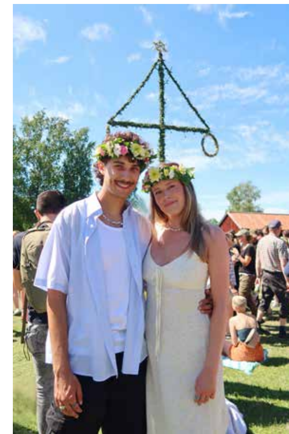
Många utbytesstudenter kom till Disagården för att få uppleva ett svenskt midsommarfirande. Musik, picknick och dans kring midsommarstången var uppskattat.