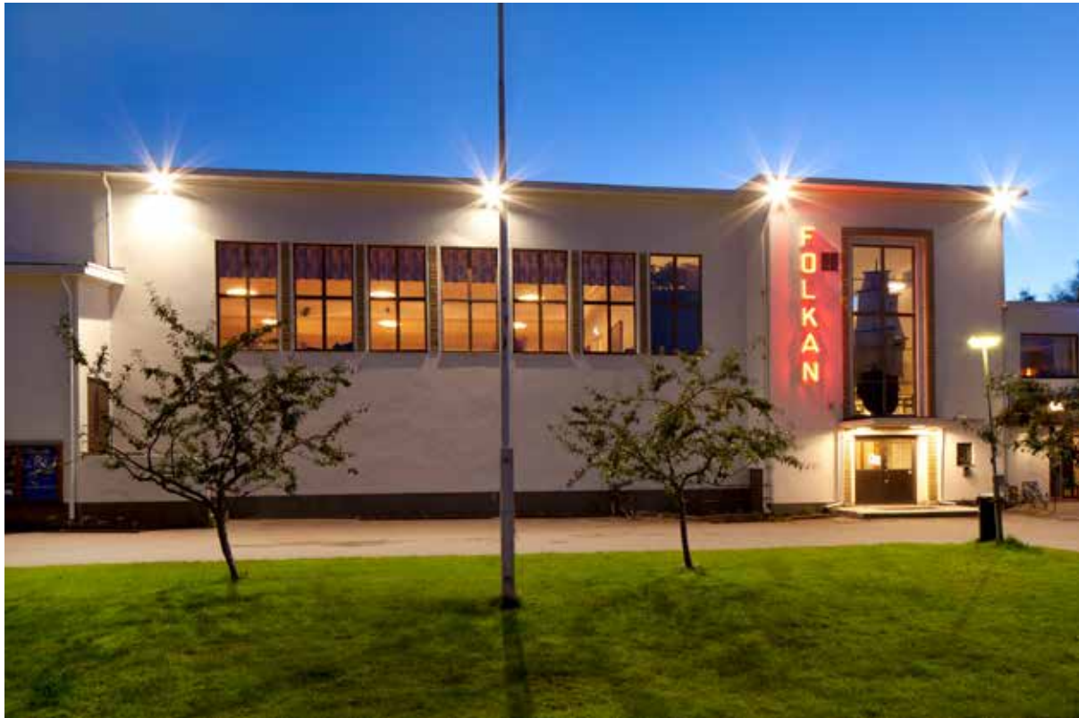
Skutskärs Folkets bus invigdes 1939. Byggnaden är Nordupplands finaste exempel på funktionalistisk arkitektur.