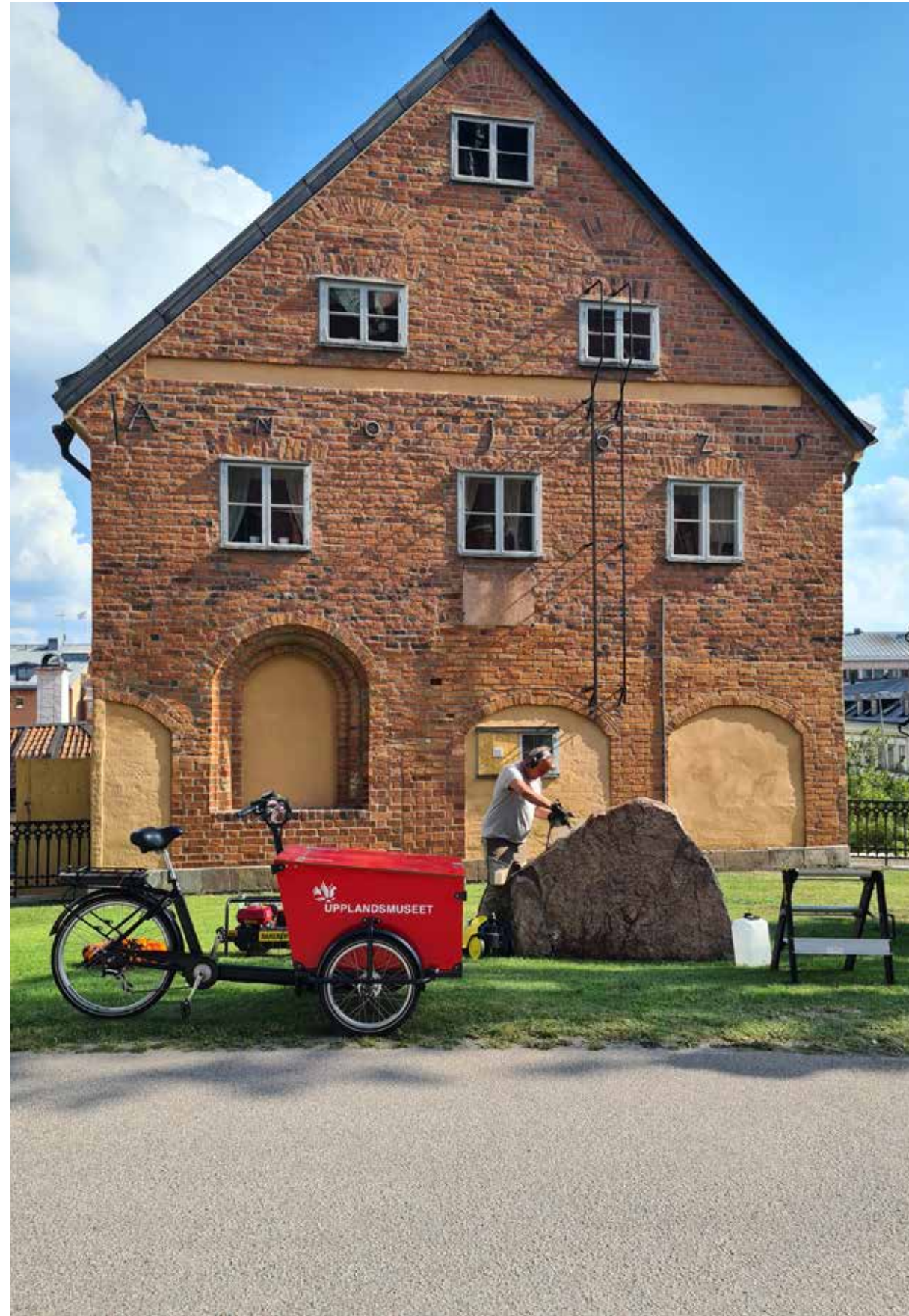
Med försiktighet, tålmod och vattenånga rengör Robin Lucas en runsten som står mellan Uppsala domkyrka och Skytteanum.