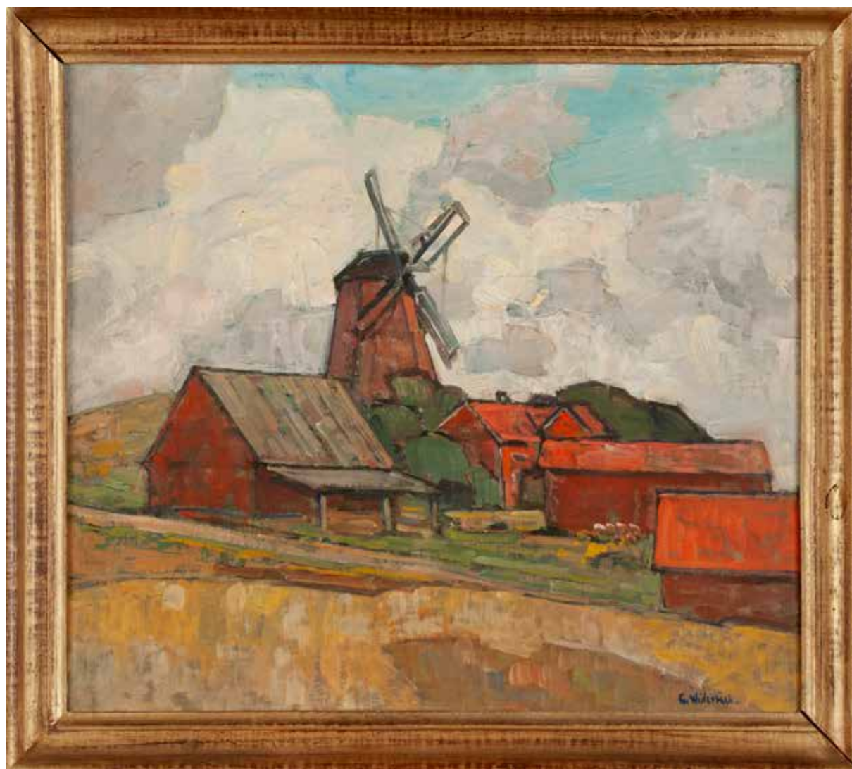
Oljemålning (UM43780) av Gustav Widerbäck.

mindre arkeologiska undersökningar på 22 olika platser, för att se om det finns fornlämningar. Utmed vägsträckan Örsundsbro-Kvarnbolund har nu åtta boplatsoområden och två gravfält från järnålder lokaliserats, liksom en medeltida bytomt vid Brunna.