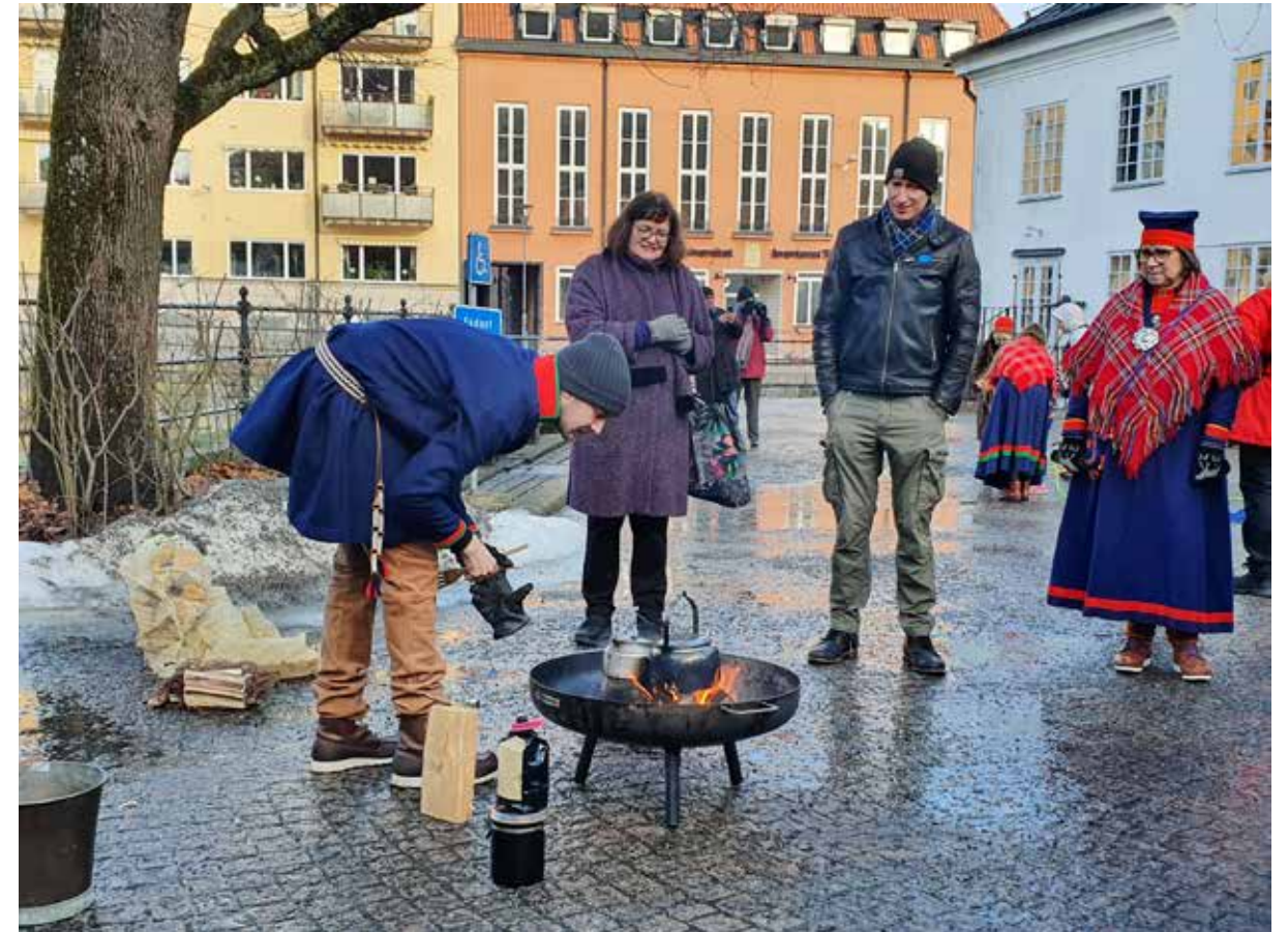
Samiska nationaldagen firades av många. Programmet arrangerades i samarbete med Samiska föreningen i Uppsala. Besökarna kunde bland annat lyssna på föredrag, kasta lassos eller lära sig att koka kaffe och laga mat över öppen eld.

Utställningsarbetet har genomförts i våningen genom att se över och inventera behov och skapa en sammanslagen lista på möjligheter och akuta åtgärder som behövs göras. Deltagande vid större festivaler och marknader i kvarteret har skett för att se hur vi kan sprida mer information om Walmstedtska på ett bra sätt.