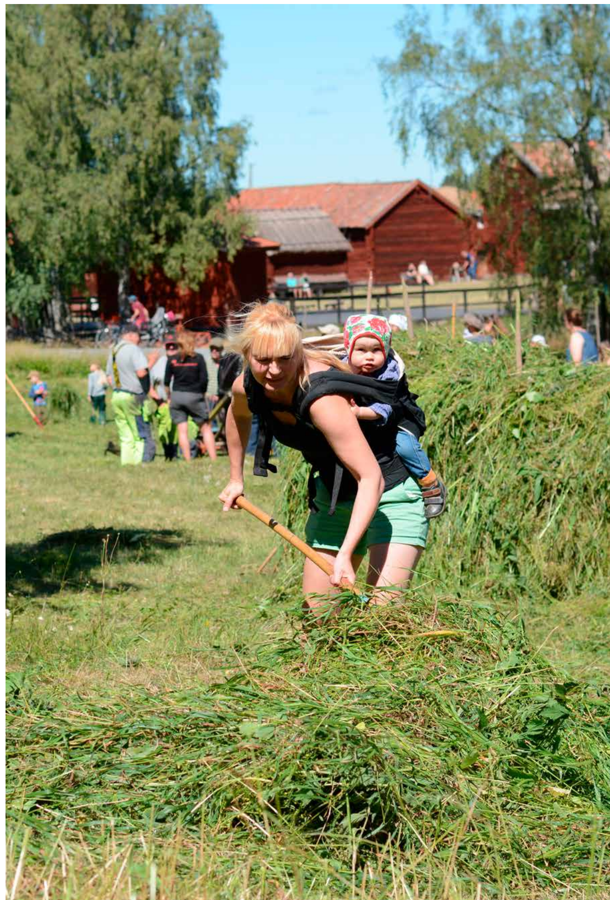
Slätter på Disagården.