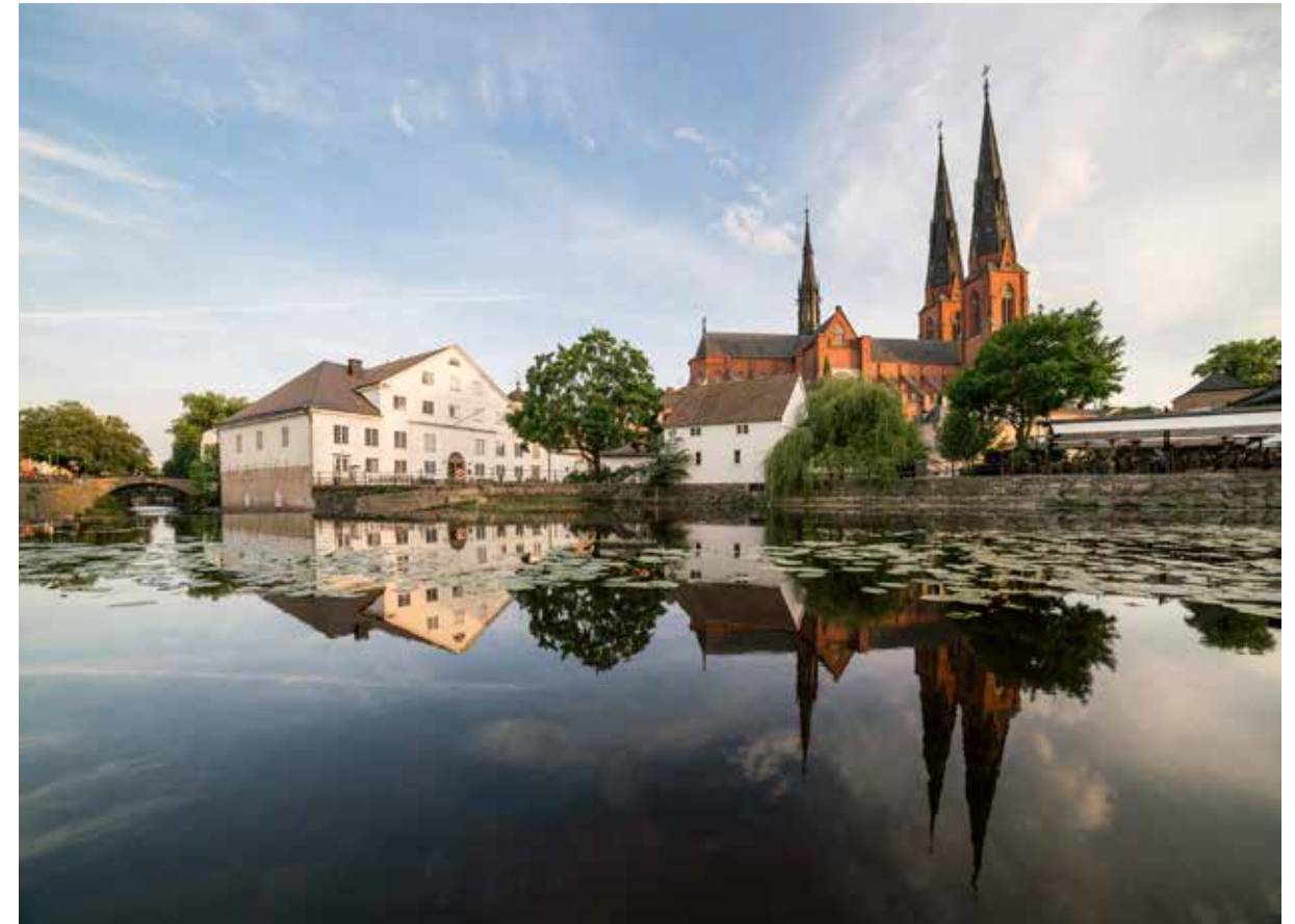
Upplandsmuseet i Akademikvarn speglar sig i Fyrisåns vatten med Domkyrkan bakom sig.

Vi arbetar för att Upplands kulturhistoria och kulturmiljöer utforskas, bevaras och tillgängliggörs. Vi