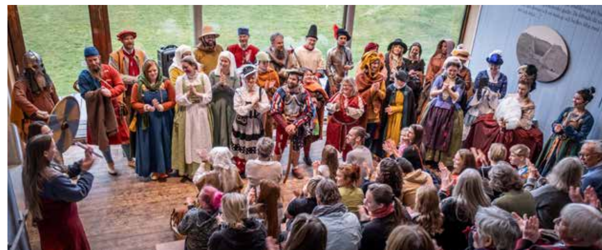
Över 1000 år av prakt och flärd.

Förutom skolloven är det Barnens dagar på Gamla Uppsala museum i augusti och Take over dagen som är viktiga barnprogramdagar. Barnens dagar på Gamla Uppsala museum är ett samarbetsprojekt med Institutionen för arkeologi och antik historia på Uppsala universitet. Under en vecka i augusti får sommarstudenterna möjlighet att praktiskt prova på sina förmedlingskunskaper då de planerar och genomför barnaktiviteter på museet.