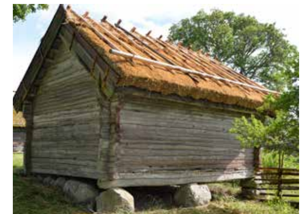
En av byggnaderna vid Kvekgården.

förening, Upplands fornminnesförening och Upplandsmuseet skött det löpande underhållet. Under året har de lerklinade väggarna i mangårdsbyggnadens kök och kammare limfärgats och stänkmålats. På mangårdsbyggnaden och spannmålsboden har lagts nya halmtak.