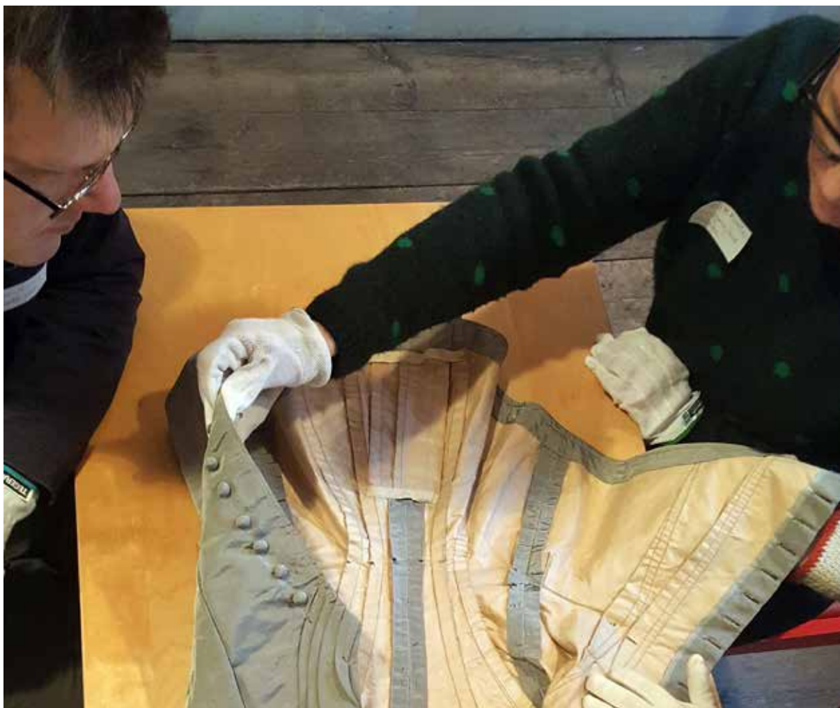
På FOMUs nätverksträff på Almgrens Sidenväveri stod föremålen i våra samlingar i fokus. Här ses forskare i färd med att försöka förstå det mesta möjliga av ett föremål de har framför sig.