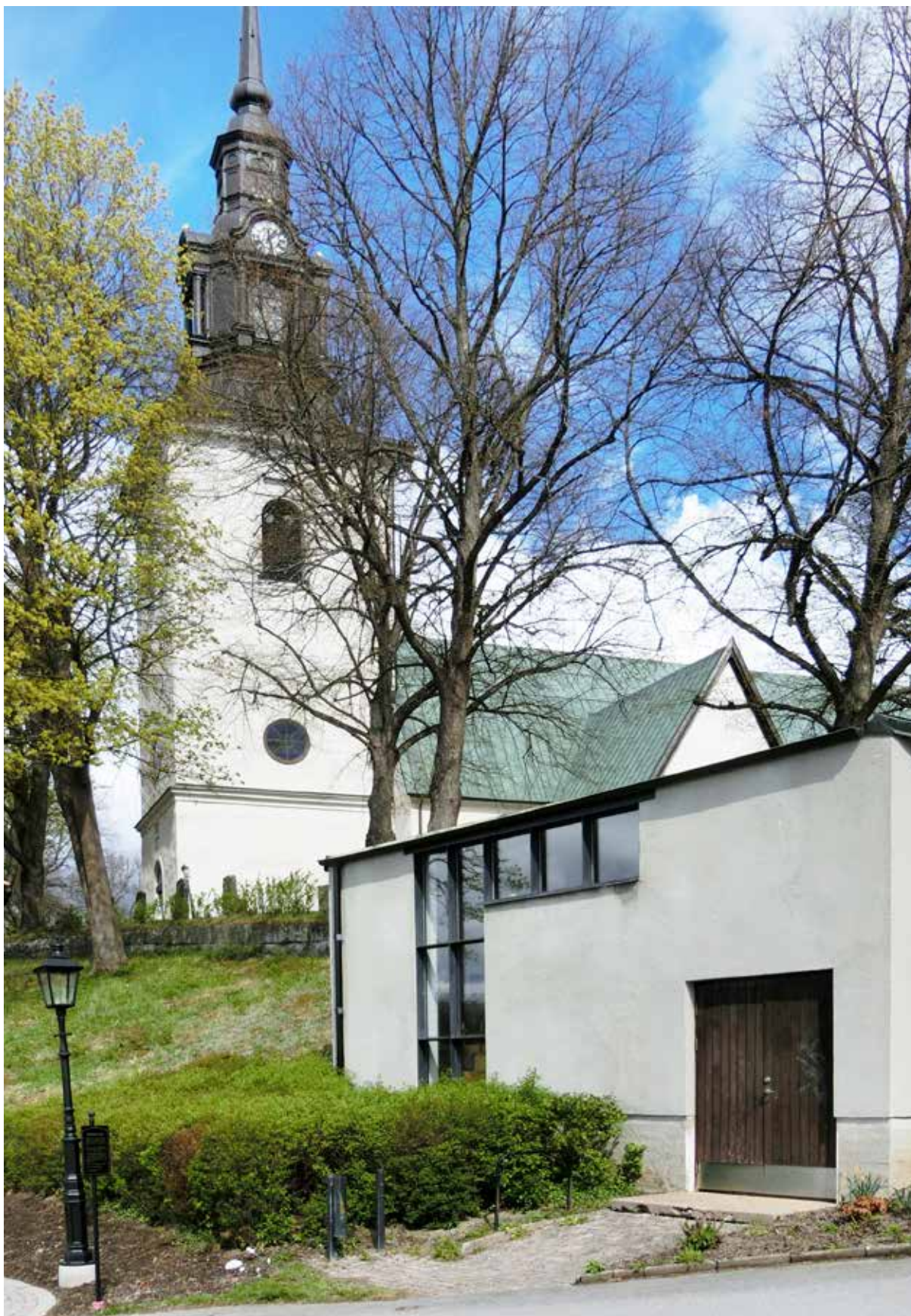
Upplandsmuseet utförde en bebyggelseantikvarisk analys av miljön kring Västerlövsta kyrka. Analysen utfördes på uppdrag av Heby kommun som planerar att uppföra ett nytt vård- och omsorgsboende i området.