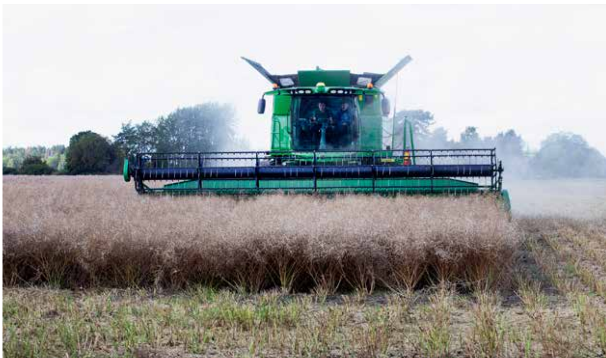
Rapsskörd på Sörgården, i sydvästra Uppland, är omslagsbild till rapporten Lantbrukare och icke-bönder av Martina Nilsson.

Projektet Mobilitet och identitet bland individer begravda i kammare och båt i östra Sverige 300–1100 e.Kr. berör män, kvinnor och barn som gravlagts i högstatusmiljöer som Fullerö, Lovö, Tuna i Alsike, Valsgärde, Vendel och Gamla Uppsala prästgård. De begravda individerna jämförs med andra, "vanligare" individer, från vikingatida gårdar på landsbygden som Eke, Görla i Frötuna och med stadsbor i Sigtuna. Studien ägde rum inom ramen för det arkeo-genetiska Atlas-projektet. Projektet finansieras av medel från Riksbankens Jubileumsfond samt från Vetenskapsrådet.