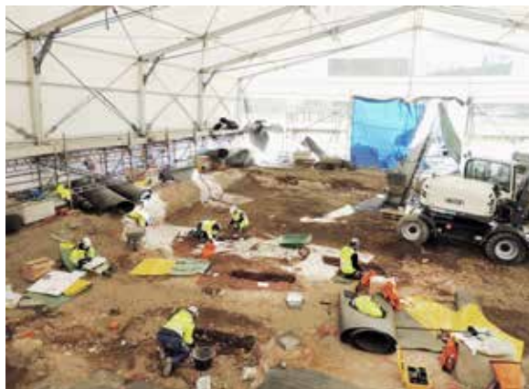
Arkeologisk undersökning på domkyrkoplan. Här undersöktes drygt 140 gravar främst från 1600–1700-talet samt rester efter domkyrkans ombyggnationer och en äldre bogårdsmur.

Upplandsmuseets arkeologer arbetade under året med undersökningar i flera kyrkomiljöer. Vid Ålands kyrka rörde arbetet endast mindre groppar intill fasaden och vid Skäifhammar behövde en gravhäll rättas till. Arbetet i Åkerby kyrka var