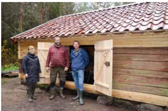
Många äldre byggnader i kulturlandskapet har förlorat sin tidigare funktion och är därför starkt hotade. Här har en gårdssmedja i Skediga i Bålinge restaurerats. Upplandsmuseet deltog med antikvarisk expertis.