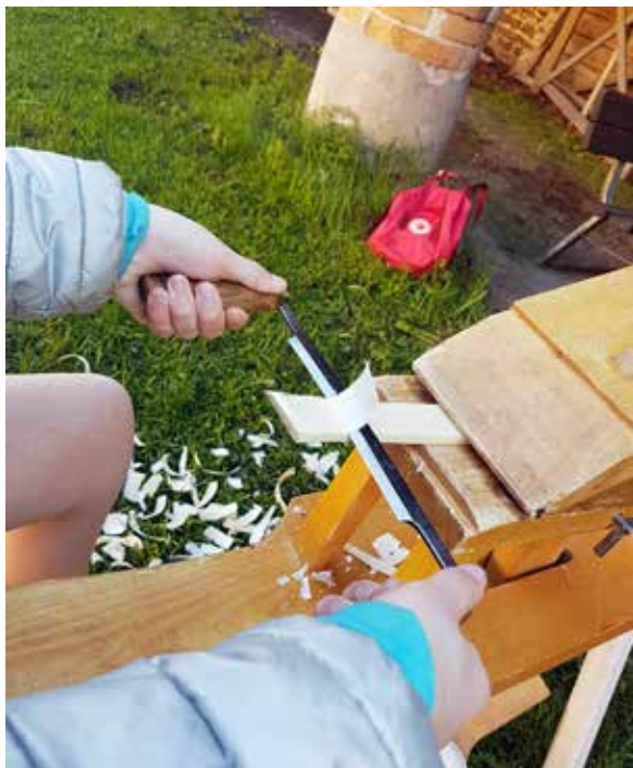
Elever lär sig om smide och trätäljning på plats i Österbybruks bruksmiljö.

I länet finns två konsulenter fördelade på 200% tjänst. Hemslöjdskonsulenter i Uppsala län (LHK) har Upplandsmuseet (UM) som huvudman.