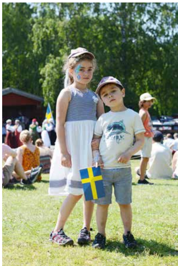
Nationaldagsfirande på Disagården.