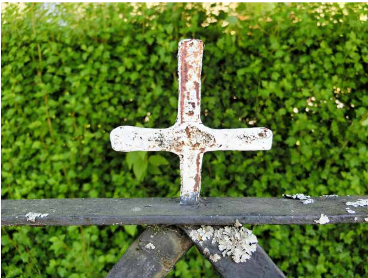
Kring Hållnäs kyrkogård uppfördes en ny stödmur mot landsvägen under första hälften av 1900-talet och muren kröntes med ett vackert smidesstaket med små vitmålade korsprydnader. Muren har nu reparerats och lagts om och staketet har restaurerats. Upplandsmuseet medverkade i arbetena som antikvarisk expert.