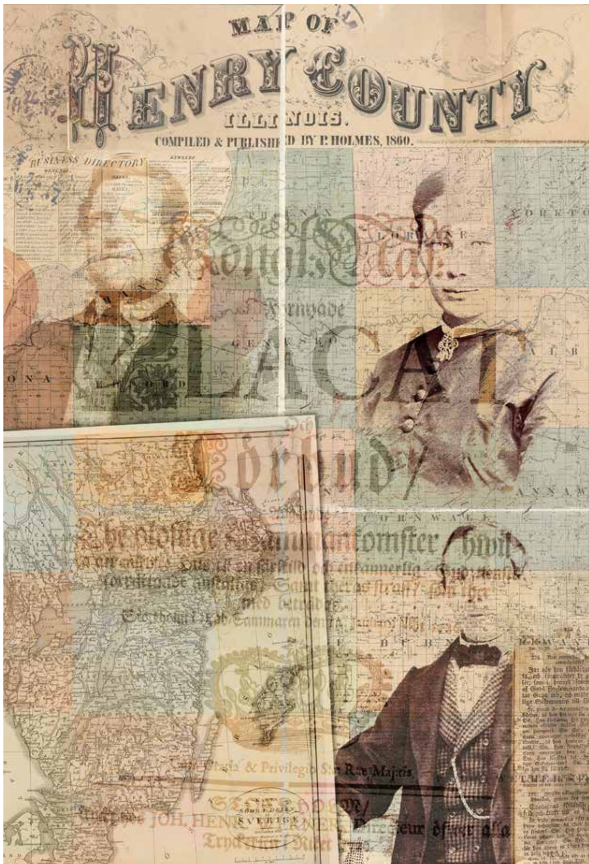
Utopi på prärien - Skuldsatt men syndfri. UtställningForm Fredrik Jobansson.