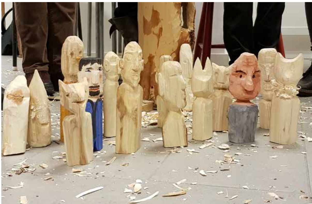
Workshop - Tälj ett arbetslag. Foto Marie Fagerlind.