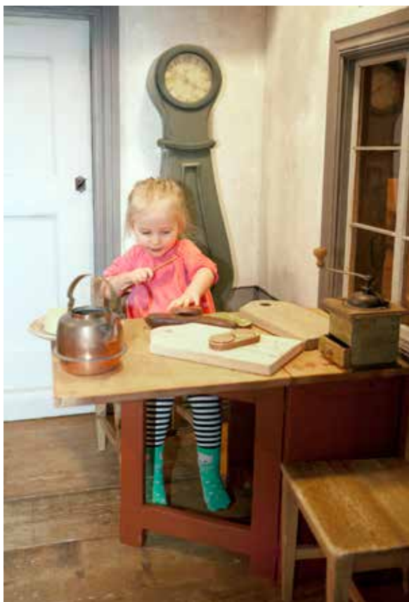
Lilla Kvarn.