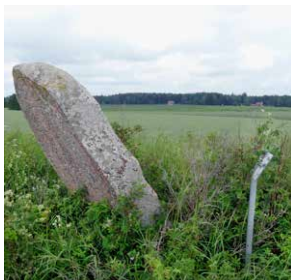
Vid årets runstensinventering dokumenterades denna runsten, U838, vid Rya kungsgård i Nysätra socken. Runstenen står precis intill länsväg 569 och möjligen har den blivit påkörd vid snöröjning.