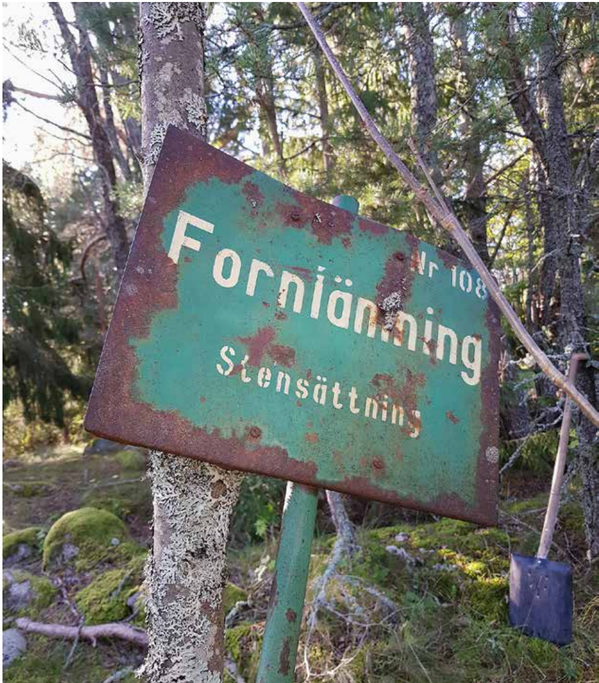
Äldre fornlämnings skylt på Enköpings garnisonsområde.

konferens öppen för såväl forskare, yrkesverksamma som andra intresserade. Konferensen arrangerades i samarbete med Barbro och Sune Örtendahls fond (finansiär). Den hölls vid museet med inbjudna föreläsare: arkeologer, språkvetare och historiker från Skandinavien och Tyskland. Åhörare var främst arkeologer från Uppsala, Gävle, Örebro och Stockholm, men även företrädare för andra ämnen som folkloristik, ortnamnsforskning, liksom intresserad allmänhet deltog.