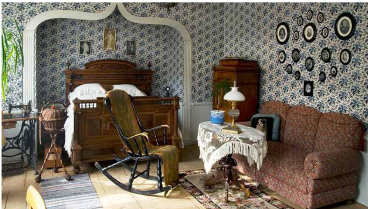
Walmstedtska gården.