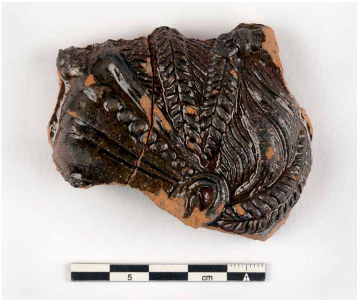
Reliefskaka (UM43366_41) med formen av ett kvinnobuvud i profil; håruppsättning med flåtor och rosett i toppen, ett pannband med pärldekor samt ett öra. Dateringen är sannolikt 1500-talets senare hälft. Föremålet påträffades vid en schaktningsövervakning som gjordes i samband med markarbeten i Kungsängsgatan, Bangårdsgatan och på Stora Torget i centrala Uppsala 2017. Fyndmaterialet från undersökningen var välbevarat och utgjordes av en relativt stor mängd läderföremål, främst delar av skor, textil, keramik, glas och järnföremål. Materialet dateras från 1300-tal till 1700-tal.

samlingarna har påträffats vid undersökningar av förhistoriska boplatser samt medeltida och sentida kulturlager i städer och i kyrkomiljöer. Vid undersökningarna påträffades främst ben och keramik, men också t.ex. läder-, horn- och metallföremål samt bitar av kakel.