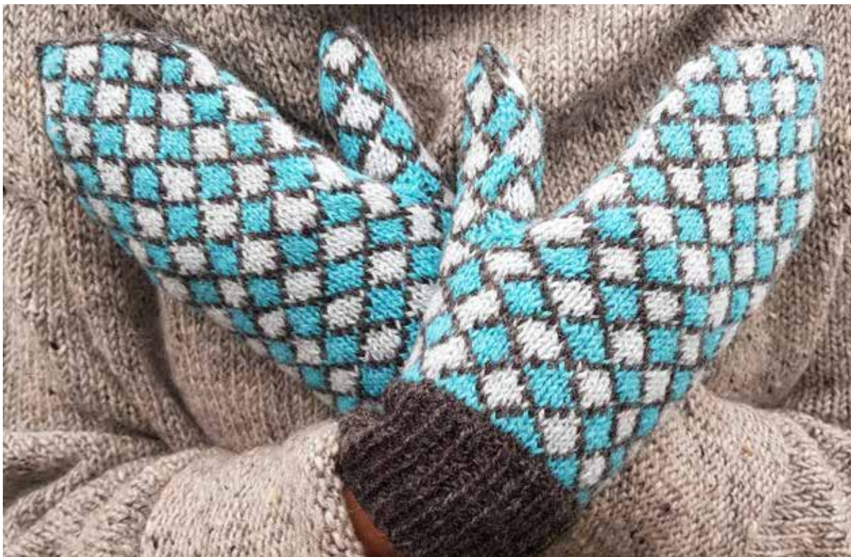
Stickade vantar med inspiration från Upplandsmuseets samlingar.