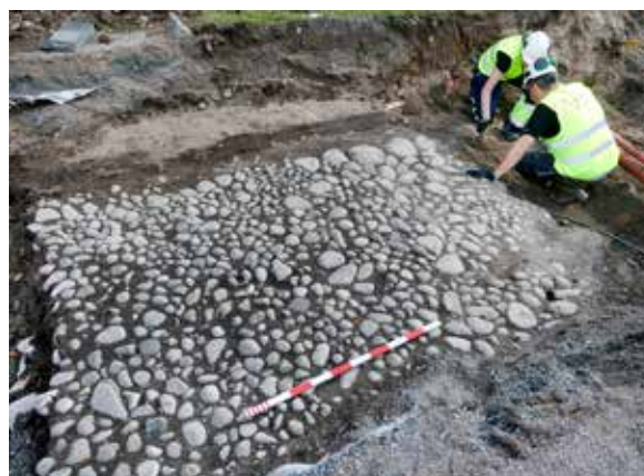
Delar av en stenlagd gårdsplan såg dagens ljus efter 400 år under marken, när museets arkeologer undersökte ett schakt utanför Carolina Rediviva i centrala Uppsala.