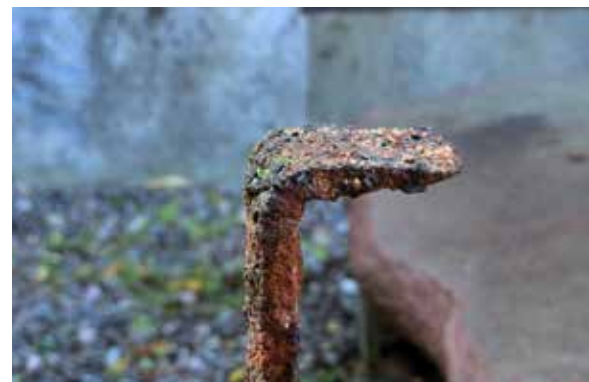
Den stora trappan till Österbybruks herrgårds huvudentré restaureras. 1700-talets stora block av gävlesandsten var sammanlänkade med smideskramlor. På ovasidan var kramlorna skyddade och fixerade med bly som smälts ner i fästena. Undersidans långa kramlor kommer att göras rena, rostskyddsbehandlas och återanvändas. Upplandsmuseet medverkade i arbetet som antikvarisk expert.

och västra flygeln inom Linnés Sävja, vid restaurering av sjöbodarna med vasstak i Långalma gistvall, vid ombyggnad av bostadshuset Ekonomien vid Örbyhus slott, inom byggnadsminnet Ekeby by i Vänge med fönsterrenovering på Karlssongården och omläggning av stickspåntak på väderkvarnen. Museet har under året fortsatt det mångåriga engagemanget för kulturmiljön på Viks slott, och i olika projekt deltagit som antikvarisk expert.