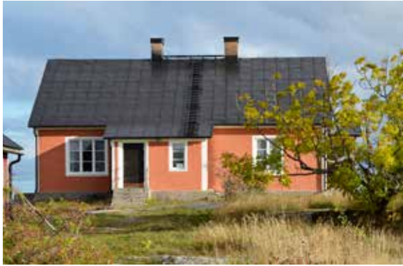
I det yttersta havsbandet utanför Hällnäs-kusten ligger Björns fyrplats med fyrvaktarbostaden från 1859. Bostaden renoverades under 2018–2019 och Upplandsmuseet medverkade som antikvarisk expert.