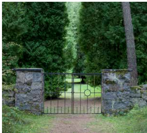
Ulleråkers begravningsplats, som invigdes 1909, har idag en parkliknande karaktär. Här har över 1200 människor begravts, men träkorsen som förr utmärkte de avlidna patienternas gravar är sedan länge borta. Idag finns bara tolv graustenar kvar.

borde ha, ifråga om trädgård och omgivande kulturlandskap. Museet har, på uppdrag av olika församlingar, fortsatt arbetet med kulturhistorisk klassificering av gravvårdar på en rad kyrkogårdar, bl.a. i Tierps pastorat, på Vaksala och Gamla Uppsala kyrkogårdar samt den speciella begravningsplatsen tillhörande Ulleråkers sjukhus. Med hjälp av klassificeringarna bevaras värdefulla gravvårdar som berättar en viktig del av socknarnas och de begravdas historia.