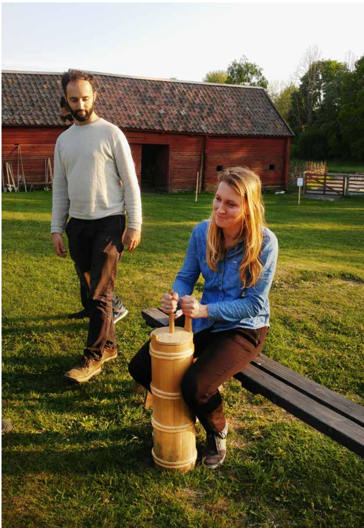
Det blev en härlig kväll på Disagården med Kulturkompis. Visning, smörkärning, lekar, fika och en massa samtal och skratt. Kulturkompis är en verksamhet där personer som är nya i Sverige och personer som har bott här länge, får chansen att dela kulturupplevelser.