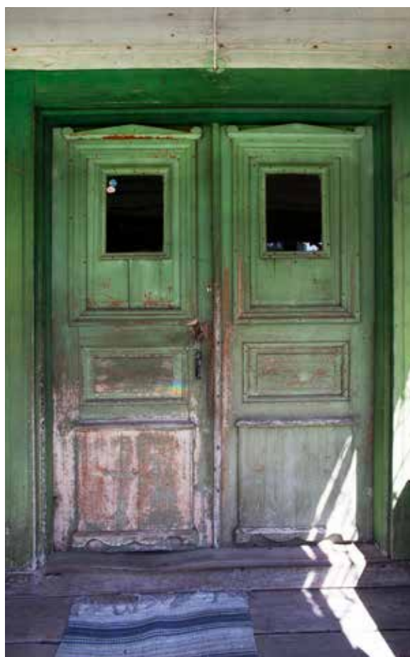
Ytterdörren till bostället i Huddunge socken som dokumenterades i bild 2019.

På avdelning Arkeologi har avrapporteringen av arkeologiska projekt skett löpande under året i form av rapporter och skrivelser. Dessa finns att ladda hem på Upplandsmuseets hemsida och via Riksantikvarieämbetets fornlämningsportal Fornsök.