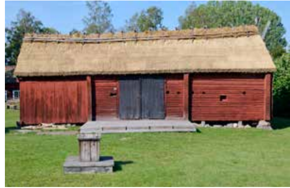
Trösklogen på Gammelmården i Knutby fick under 2019 nytt vasstak och Upplandsmuseet deltog som antikvarisk medverkande.