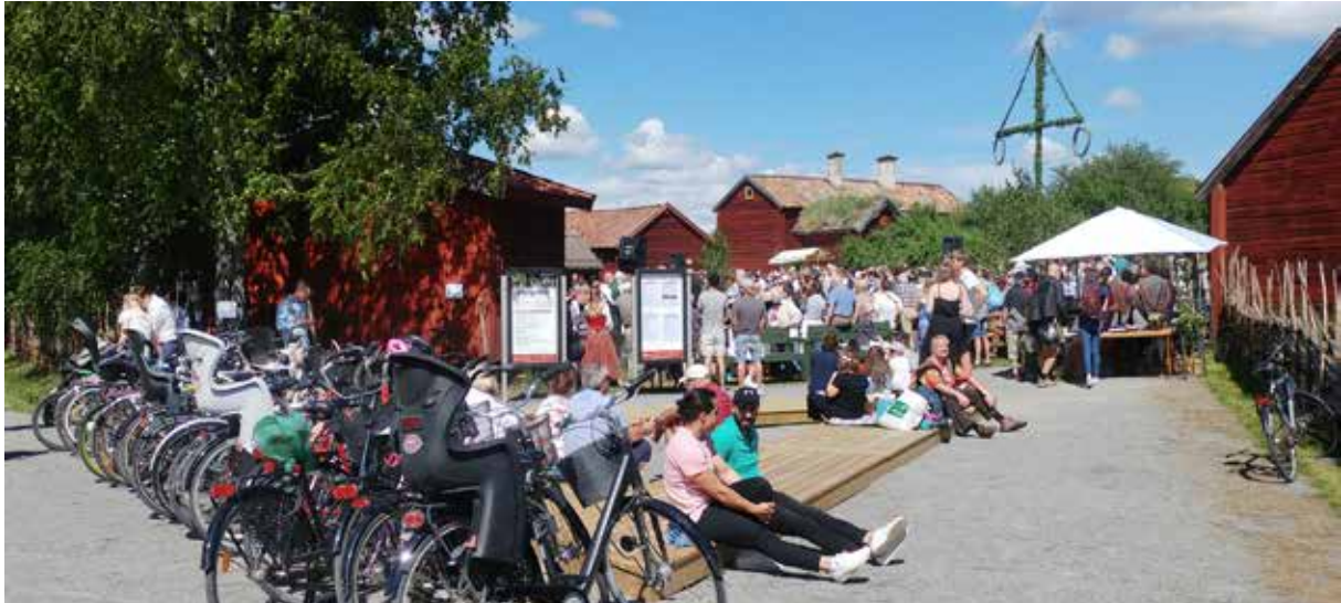
Arbetet med att utveckla Disagården som besöksmål pågår ständigt. Den nya entrén är en del i arbetet att göra Disagården mer tillgängligt för fler.

Museet har också deltagit som antikvarisk expert vid ombyggnaden av längan på Walmstedtska gården i Uppsala för Konstnärsklubbens verksamhet. Museet har deltagit som antikvarisk sakkunnig kontrollant vid om- och tillbyggnaden av Uppsala stadshus. Efter branden i Tobo masugn gjorde museet en kulturhistorisk bedömning och bestämning av åtgärder efter avslutade rivningsarbeten.