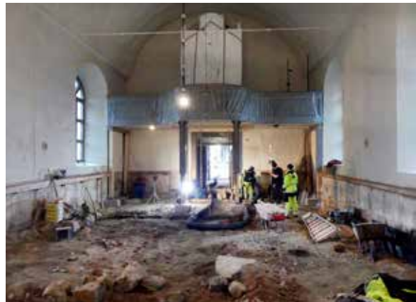
Arkeologisk undersökning i Åkerby kyrka där golvet i kyrkan renoveras. Under kyrkgolvet påträffades bland annat fundament till äldre valpelare och sidoaltare.

Vidare har museet på uppdrag av Sveriges Lantbruksuniversitet gjort en utredning av Funbo-Lövsta herrgård. Utredningen visade på nya insikter i byggnadens historia, bl.a. att en stor del av 1700-talsinredningen i rokokostil är bevarad. För byggnadsminnet Granbo i Östhammars kommun, utredde museet vilken storlek byggnadsminnet