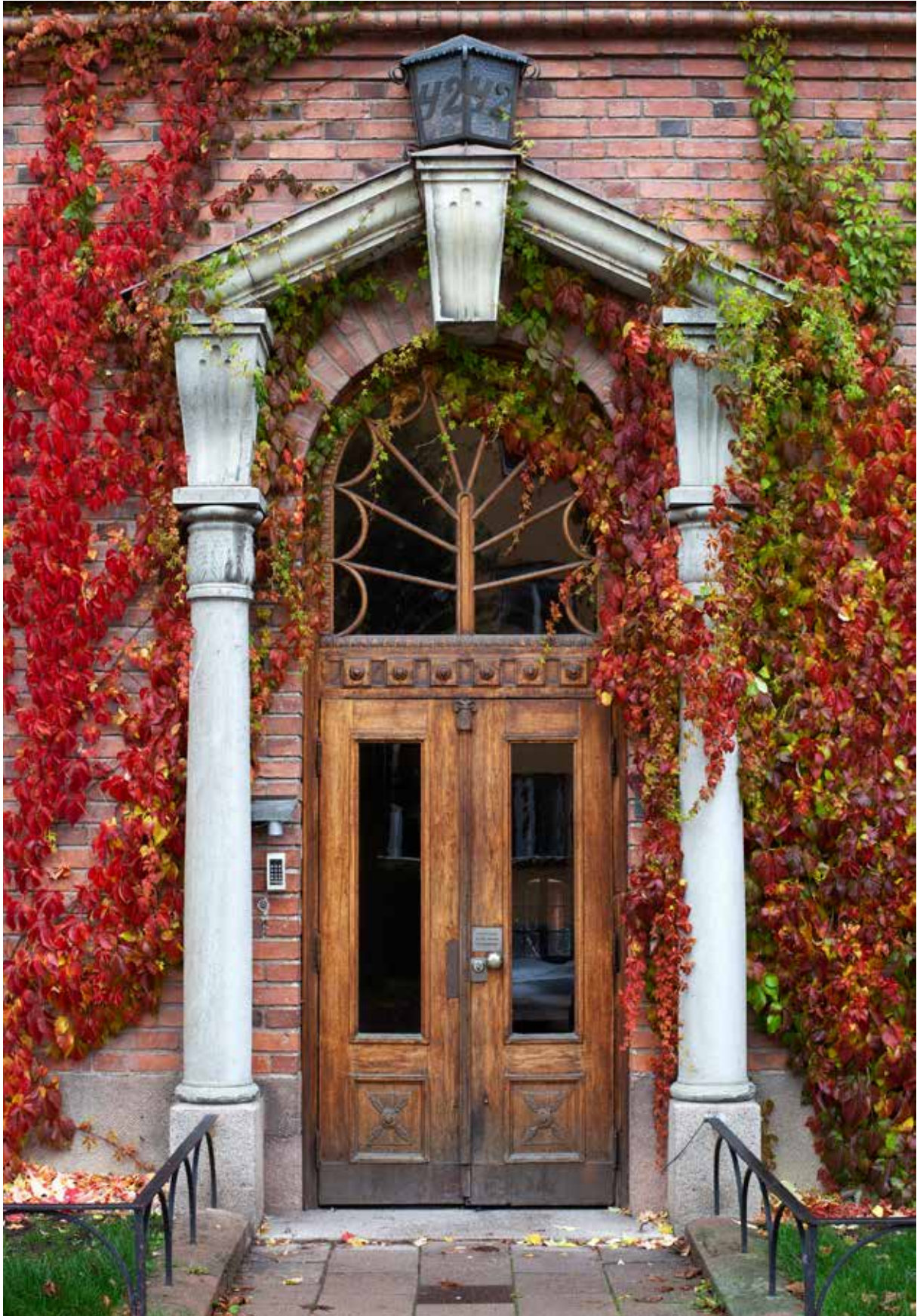
Det påkostade S:t Eriks huset, ett hyreshus uppfört 1928–29 av AB S:t Eriks Lervaruifabriker, är ett säregnet inslag i Uppsalas 1920-talsarkitektur. Under 2019 tog Upplandsmuseet fram ett kunskapsunderlag för denna kulturbistoriskt värdefulla byggnad.