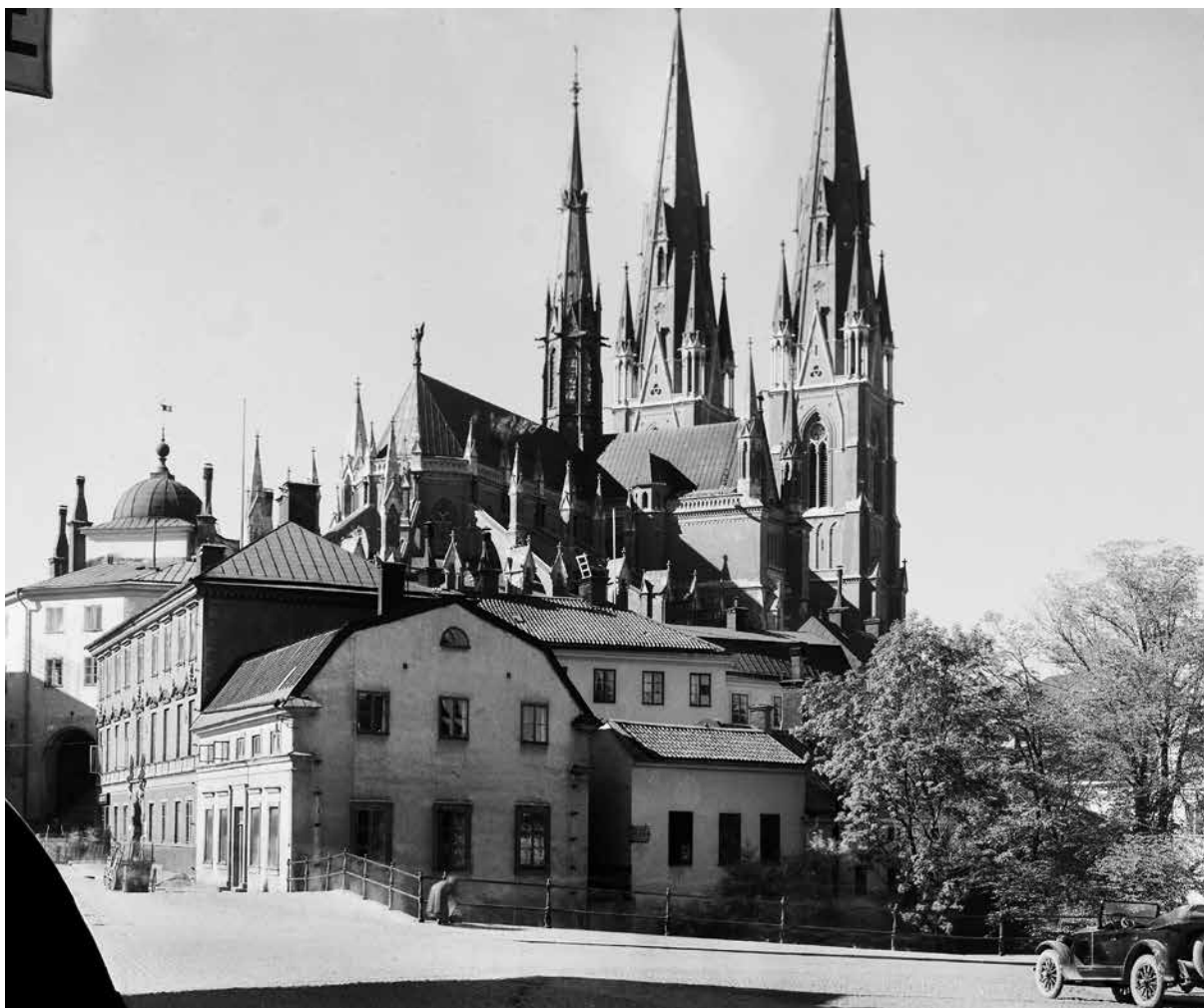
En av de glasplåtar (UP5510) som förvärvades under 2019. Vy från Gamla torget mot kvarteret Holmen med Uppsala domkyrka i bakgrunden.