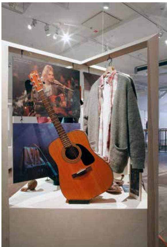
Kulturkoftor och Sagotröjor.