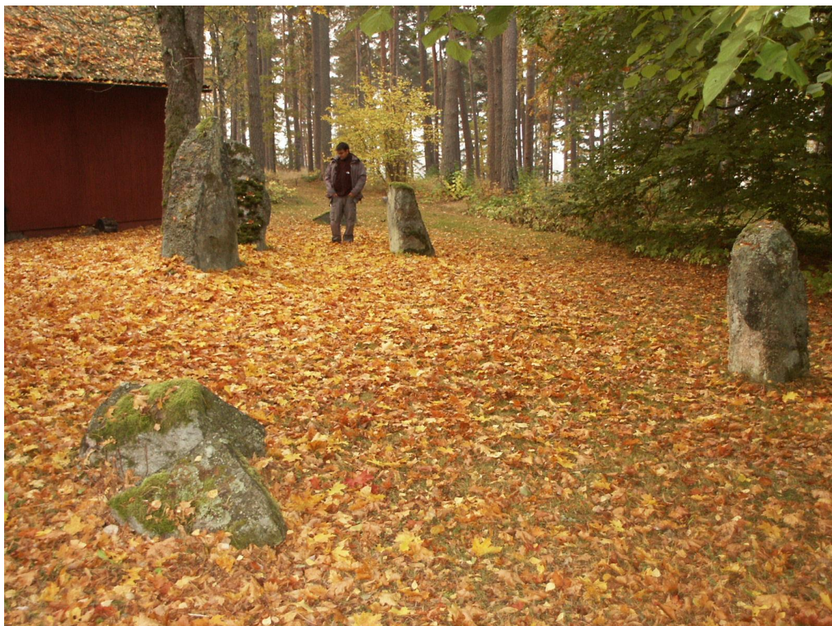
Figur 3. Raä 68 som den såg ut då undersökningen inleddes. I bakgrunden syns Robin Olsson.

Vid den arkeologiska undersökningen av lämningen kunde konstateras att antalet resta stenar var sju varav den sydvästra och nordöstra stenen fallit omkull. Den nordöstra stenen hade även spruckit i två delar. Lämningen var belägen mellan huvudbygganden och vedboden. Stenarna var 1-2 m höga, 0,6-1,3 m breda 0,4-0,7 m tjocka. De var placerade i två rader, närmast i par med en överbliven sten med ett par meters mellanrum (fig 3). Vad som missats vid besiktning av fornlämningen var att alla stenar var försedda med parvis placerade borrhål i nedre delen samt att den omkullvälta stenen även hade ett bormärke efter brytning på undersidan (fig 4).