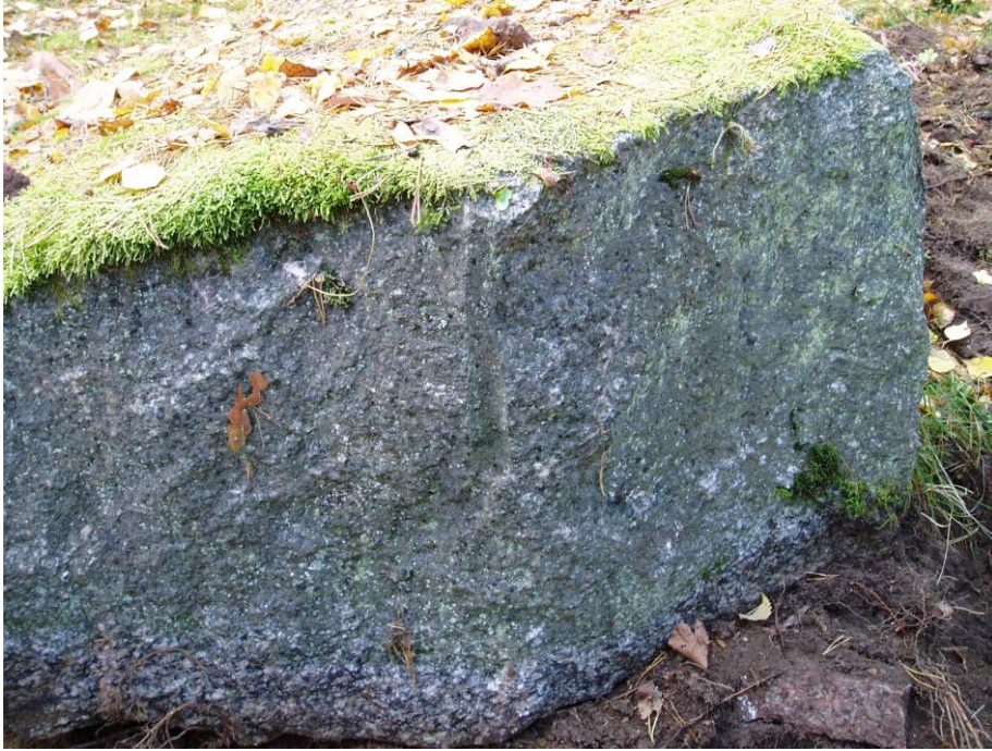
Figur 4. Borrhålet i botten på den välta stenen i söder.

Vid varje omkullfallen sten grävdes två meterrutor (fig 5). Rutorna grävdes för hand med spade och skärslev. I groparna påträffades glas, tegel och stengods. Inga anläggningar eller fynd vittnade om förhistoriska aktiviteter. Avsaknaden av förhistoriska lämningar och borrhålen i stenarna gör att lämningen tolkas som uppförd i sen tid.