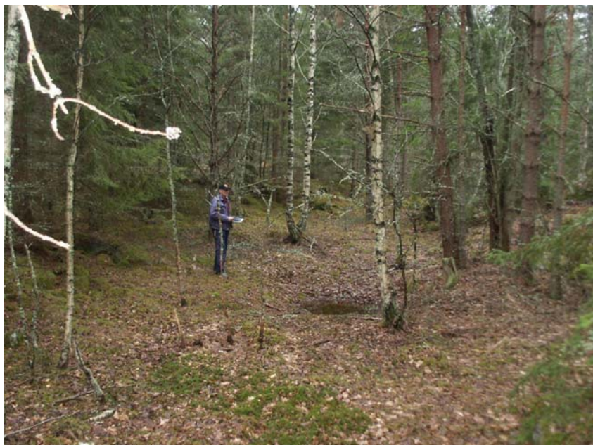
Figur 5. Dan Fagerlund vid den grävda gropen i skogen (nr 5 på fig 2).

Detsamma gäller det större åkerområdet i norr som motsvaras av Hagmyran. Det har inte gått att se några indikationer på att det skulle finnas inslag av fornlämningar inom den delen även om den bedömningen var svårare att göra då marken här var oplöjd. Namnet berättar en del om markbeskaffenheten. Det var låglänt och surt och hela området låg i ett sorts bakläge. Det saknas också kända eller registrerade fornlämningar i terrängen runt det stora åkerområdet. Längst i norr vidtar dock några platåliknande förhöjningar i åkermarken som mycket väl kan innehålla t ex en boplatzlämning men de ligger nära den befintliga vägen utanför det planerade exploateringsområdet. Även österut längs skogskanten, under namnet Stavby på figur 2, finns några förhöjningar, där det inte kan uteslutas att det kan förekomma fornlämningar i form av boplatssytor. Även dessa ytor låg dock utanför utredningsområdet.