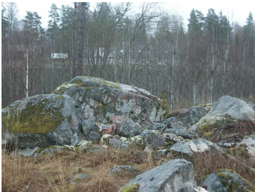
Figur 4. Foto på den röseliknande anläggningen i krönläge (nr 2, fig 2). Fotot är taget från sydväst. I bakgrunden, över hustaken, finns flera tydliga rösen som bl a hör till raä 32.

Detsamma gäller det större åkerområdet i norr som motsvaras av Hagmyran. Det har inte gått att se några indikationer på att det skulle finnas inslag av fornlämningar inom den delen även om den bedömningen var svårare att göra då marken här var oplöjd. Namnet berättar en del om markbeskaffenheten. Det var låglänt och surt och hela området låg i ett sorts bakläge. Det saknas också kända eller registrerade fornlämningar i terrängen runt det stora åkerområdet. Längst i norr vidtar dock några platåliknande förhöjningar i åkermarken som mycket väl kan innehålla t ex en boplatzlämning men de ligger nära den befintliga vägen utanför det planerade exploateringsområdet. Även österut längs skogskanten, under namnet Stavby på figur 2, finns några förhöjningar, där det inte kan uteslutas att det kan förekomma fornlämningar i form av boplatssytor. Även dessa ytor låg dock utanför utredningsområdet.