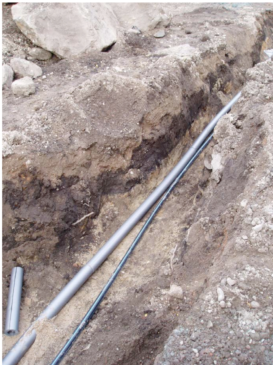
Figur 3. Detalj av ledningsschaktet. Ovanpå den ljusa sjösanden syns det mörka kulturlagret med en tjocklek av ca 0,3 meter.

från 0,4-1,2 m. Dessa låg till största delen i sjösanden men nådde på vissa platser även upp i fyllnadslagret. Några spår efter ytligt berg iakttogs inte.