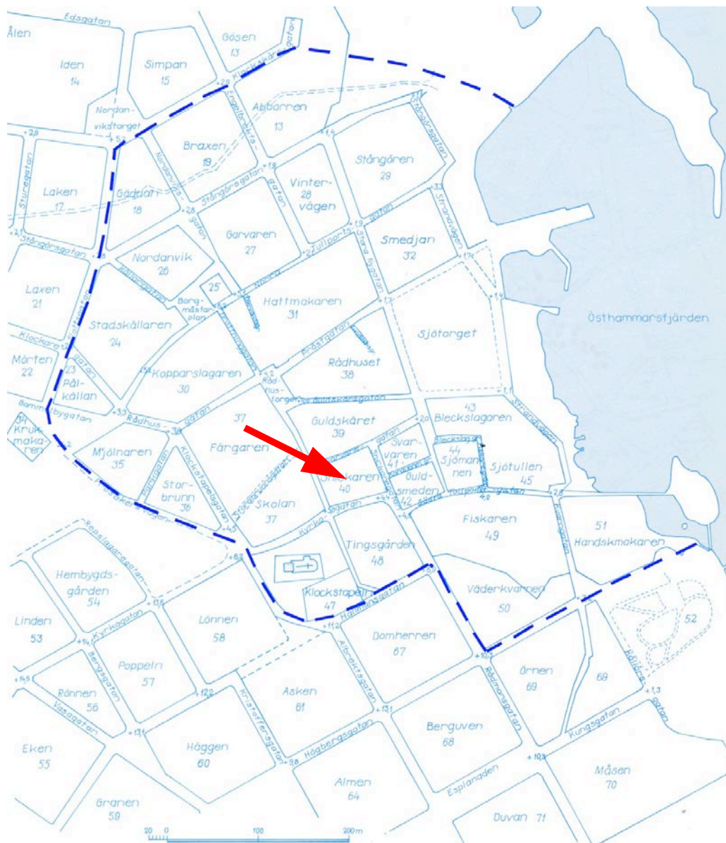
Figur 1. Östhammar med begränsningslinjen för Raä 141, Östhammars medeltida stadsområde, markerad. Pilen visar platsen för aktuell schaktningsövervakning. Karta ur Medeltidsstaden 63.