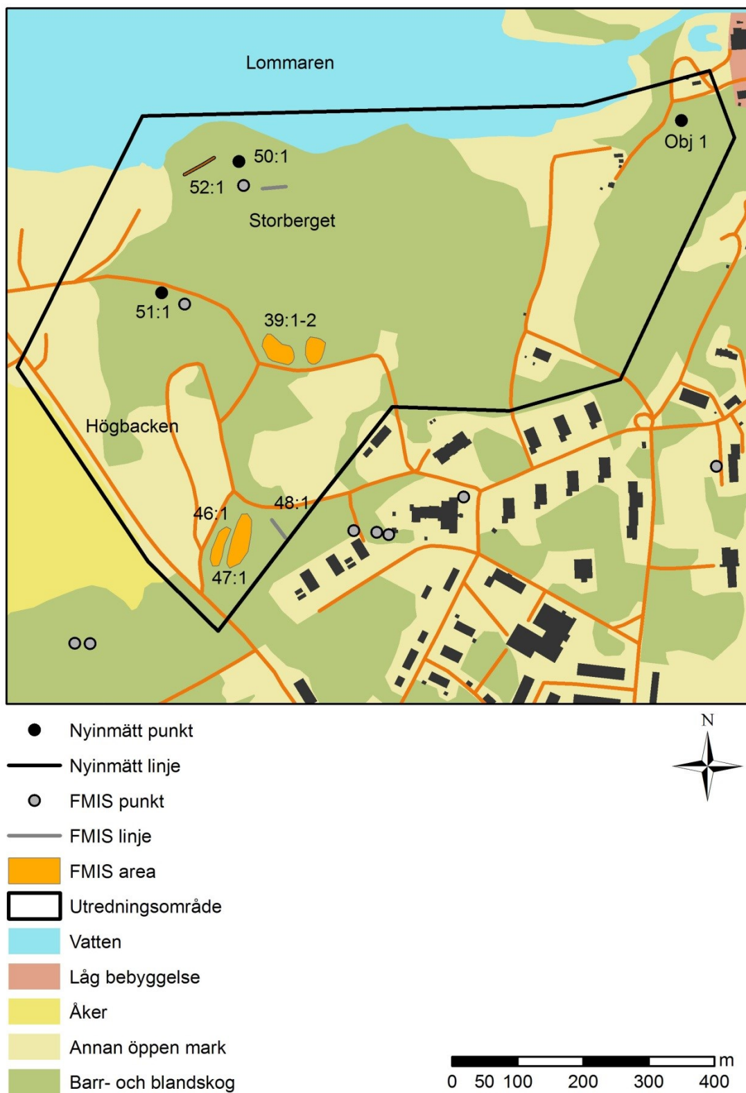
Figur 2. Utredningsområdet med lämningar markerade. Ny- eller ommätta lämningar jämfört med vad som är angivet i FMIS är markerade med svart punkt respektive linje. Skala 1:8 000.