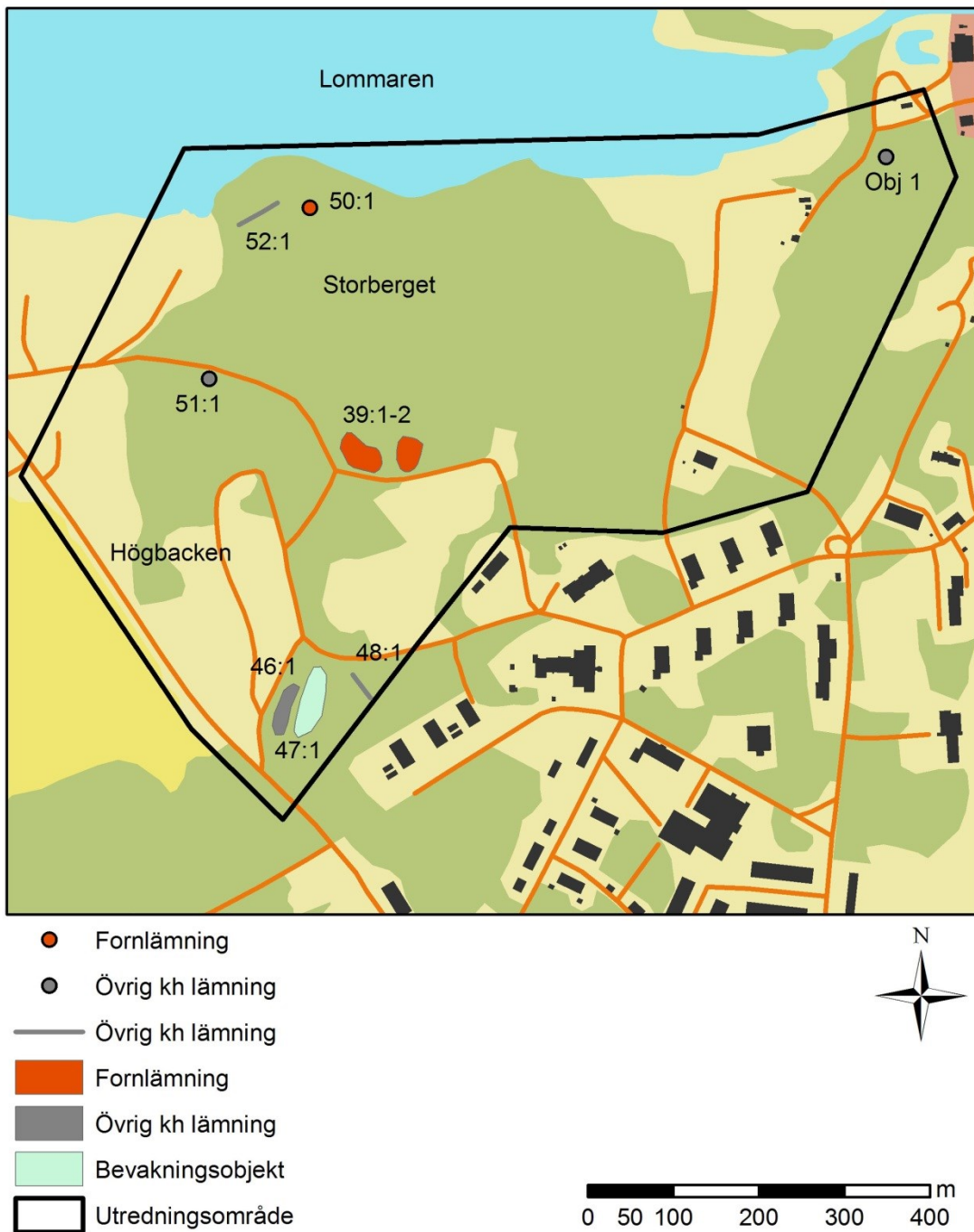
Figur 4. Antikvarisk bedömning av lämningar inom utredningsområdet. Lämningar bedömda som fornlämning är rödmarkerade. De som är bedömda som Övrig kulturhistorisk lämning är gråmarkerade. Bevakningsobjekt har ljusgrå markering. Skala 1:8 000.