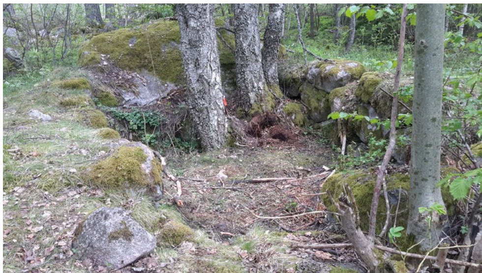
Figur 3. Källargropen inom lägenhetsbebyggelsen Norrtälje 46:1 hade murar av stora stenar och anslöt till ett markfast block. Här sedd från norr.

I områdets sydvästra hörn finns lägenhetsbebyggelsen 46:1, de sammanförda lämningarna 47:1 och stenvuren 48:1. Lägenhetsbebyggelsen 46:1 består av en tydlig källargrund, ett spisröse som alternativt kan vara en uppkastad dumphög, markröjda ytor och täktgropar. Lämningen bör motsvara en symbol för bebyggelse på häradsekonomiska kartan.