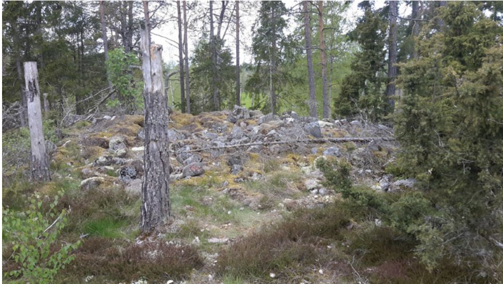
Figur 3. Röset 98:1 är relativt flackt och ligger vid kanten av bergskrönet. Här sedd från norr.

och utanför utredningsområdet ligger röset 201:1. Det ligger ca 15 m från utredningsområdets gräns. Terrängen är relativt flack i den anslutande delen av utredningsområdet som bara ligger aningen lägre än röset. Därmed skiljer sig den topografiska situationen avsevärt från 98:1 med dess naturligt avgränsade bergsplatå. De två rösetna ligger i likhet med stensättningen 99:1 på bergskrön med god exponering över dalgången i väster, bland annat den närbelägna gården Kullersättra.