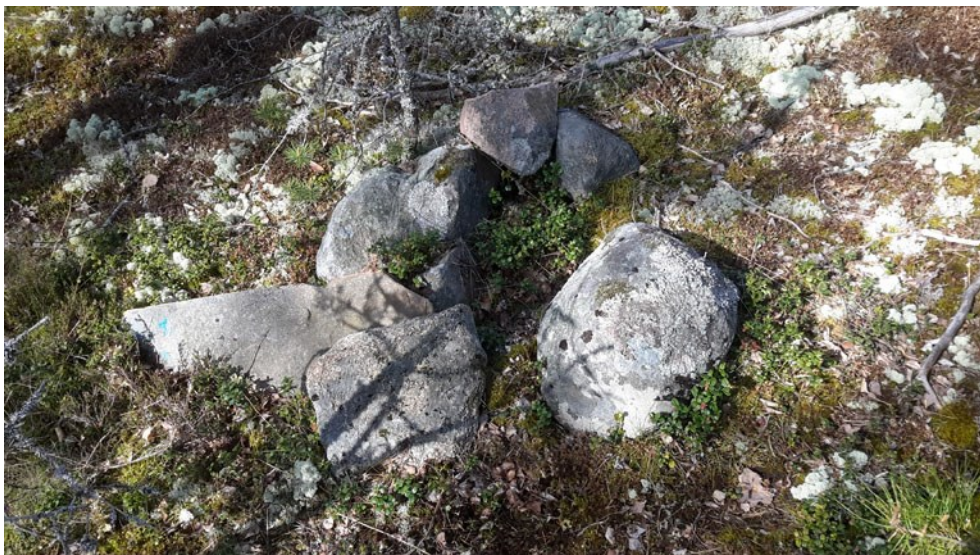
Figur 4. Gränsmärket objekt 1 med den kullfallna skarpkantade visarstenen. Här sedd från norr.