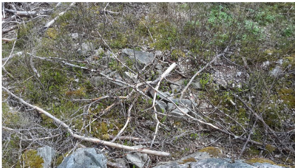
Figur 5. Vid stenbrottet objekt 2 låg spill från brytning och bearbetning nedanför, men ett stycke ut från bergskanten. Här sedd från söder.

I områdets norra del ligger Objekt 2 som är spår av troligt mindre stenbrott. Vid den Ö kanten av en bergskant har berget en kraftig, naturlig sprickbildning. Möjligen finns också spår av tillmakning. Ett stycke utanför bergskanten finns en 2,5x1 m stor yta med en större mängd spill av skärvig granit, vilket troligen är spår av bearbetning.