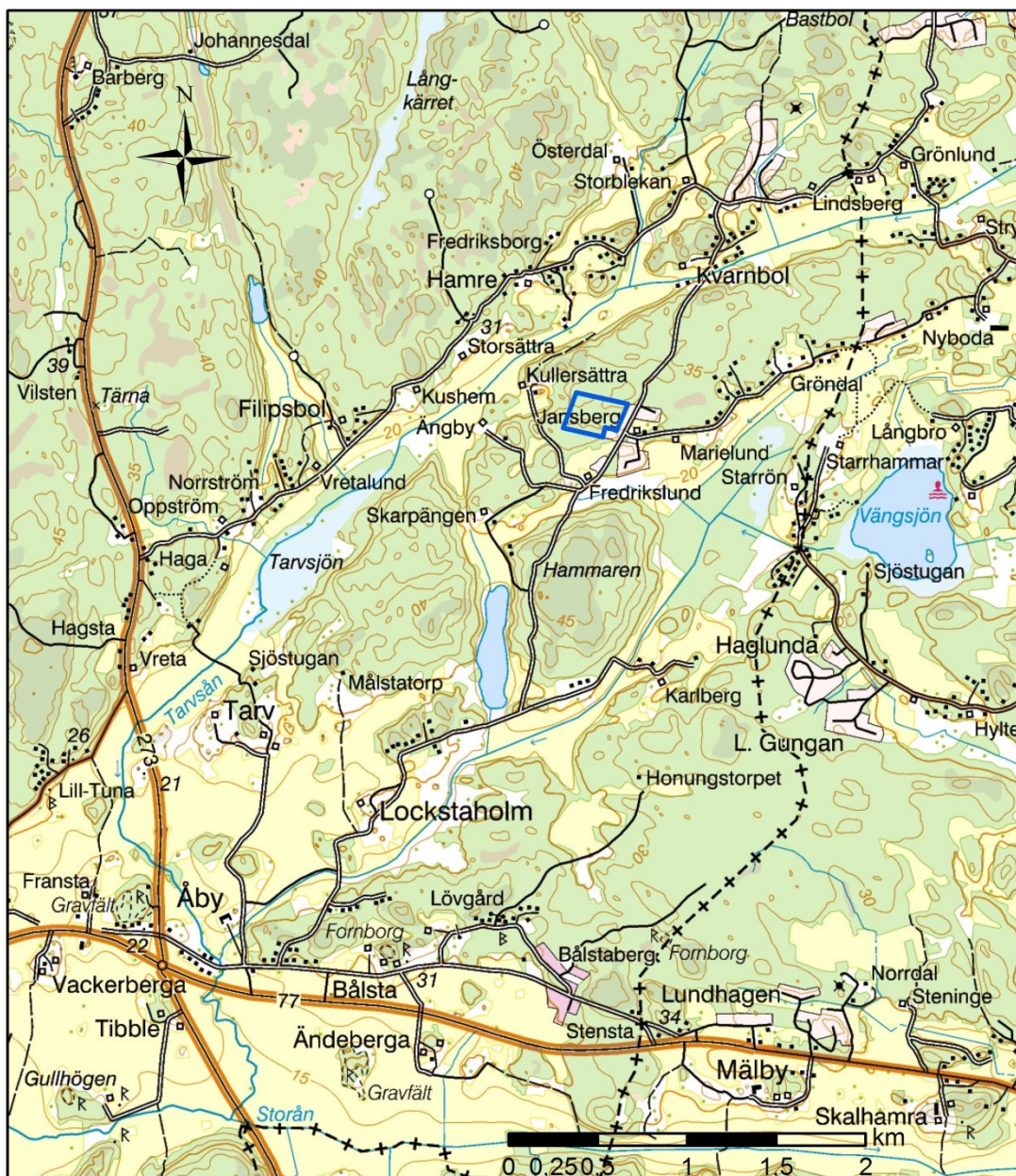
Figur 1. Översiktskarta över Husby-Långhundra med utredningsområdet markerat med blå linje. Skala 1:40 000.

Upplandsmuseet utförde under maj 2015 en arkeologisk utredning, steg 1 inom fastigheten Målsta 2:38, Jansberg i Husby-Långhundra inför detaljplan för bostäder (fig 1). Utredningen gjordes på uppdrag av Famili Invest AB och efter beslut av Länsstyrelsen i Uppsala län (lstn dnr 431-4887-2014). Projektledare var Hans Göthberg.