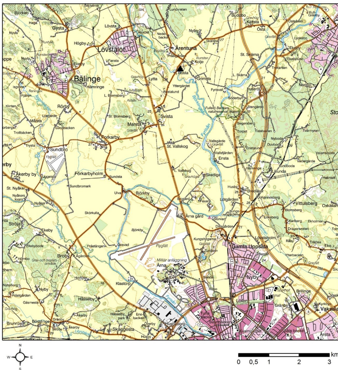
Figur 1. Översiktskarta över området norr om Uppsala med Kolje markerat med svart trekant. I dess omgivning ses även Nederbacka, Ärentuna och Rosta. Skala 1:75 000.

Upplandsmuseet utförde under september 2015 en begränsad arkeologisk förundersökning inom gravfältet Ärentuna 6:1, fastigheten Kolje 7:1 i Ärentuna inför flyttning av runstenen U1021 (fig. 1). Förundersökningen gjordes på uppdrag av och efter beslut av länsstyrelsen i Uppsala län (lstn dnr 431-4907-2015). Projektledare var Hans Göthberg.