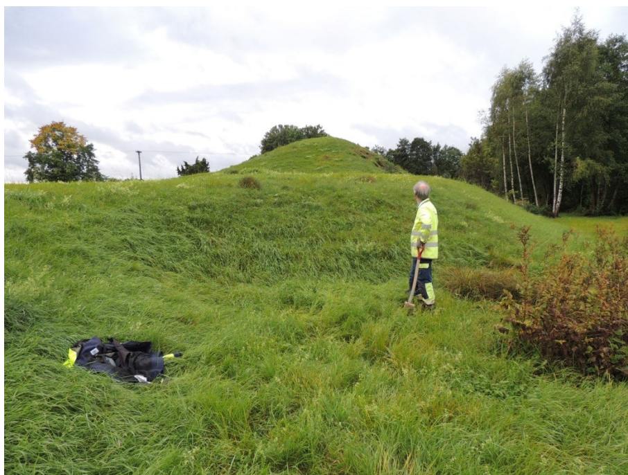
Figur 4. Förundersökningsytan låg i en närmare 2 m djup fördjupning invid vägen, troligen spår av en täkt. Djupet framgår i jämförelse med Hans Göthberg. I bakgrunden den största gravhögen inom gravfältet. Här sedd från norr.

naturligt avsatt. På gränsen mellan matjord och lera fanns en 0,10 m stor sten. Inga tecken på vare sig äldre eller sentida mänsklig påverkan kunde urskiljas.