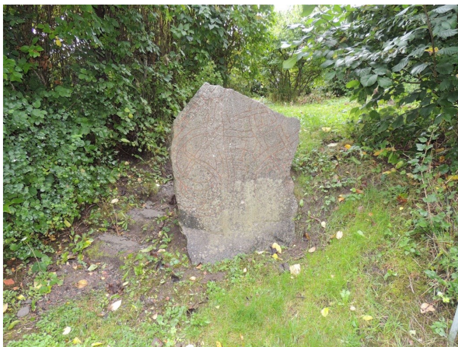
Figur 2. Runstenen U1021 på sin nuvarande plats vid Rosta. Här sedd från norr.

Runstenen U1021, (Bälinge 141:1) stod enligt uppgifter från 1600-talet vid norra sidan av ån nära bron (fig 2). Under 1800-talet var den försvunnen, men efter att 1920 ha återupptäckts vid Rosta kvarn har den rests på den södra sidan av ån (Wessén & Jansson 1953 s 244ff).