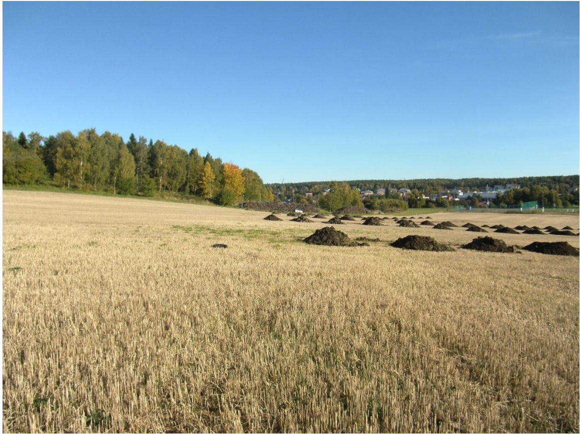
Figur 5. Utredningsområdets västra kant där kulturlagret påträffades ligger i den påtagliga sluttningen. Högre upp i sluttningen och till vänster i bild ligger boplatsen Kalmar 107:1. Här sedd från söder.