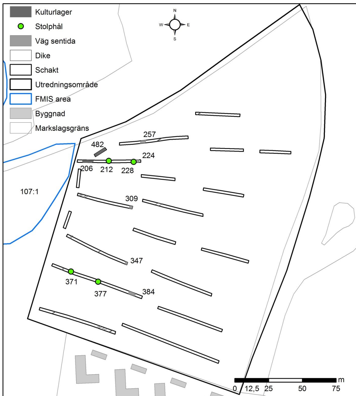
Figur 3. Utredningsområdet med lämningar i schakten markerade. Skala 1:1600.

Utredningsområdets yta uppgick till 36 000 m 2 och utgjordes av åkermark. Inom ytan maskingrävdes 20 sökschakt med en sammanlagd area av 1530 m 2 (fig. 3). De lämningar som påträffades inom ytan utgörs av lager, stolphål och sentida lämningar som en väg och diken.