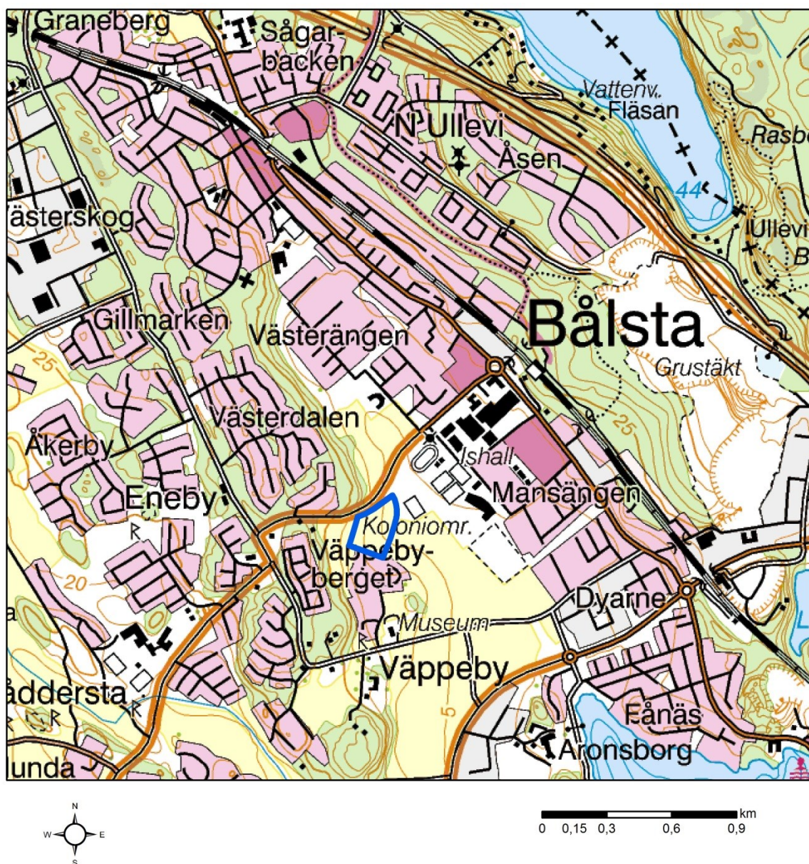
Figur 1. Översiktskarta över Bålsta med utredningsområdet markerat (blå linje). Skala 1:25000.

Upplandsmuseet utförde under oktober 2015 en arkeologisk utredning med grävning av schakt vid Väppeby i Kalmar socken i Håbo kommun inför genomförande av detaljplan (fig. 1). Utredningen gjordes på uppdrag av Håbo kommun, Plan- och utvecklingsenheten och efter beslut av länsstyrelsen i Uppsala län (lstn dnr 431-3169-14). Projektledare var Hans Göthberg.