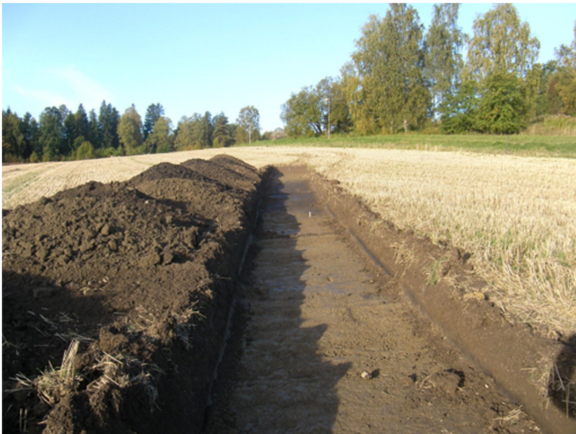
Figur 4. Kulturlagret 206 är betydligt mörkare än de naturligt avsatta leran och silten i slutningen. Högre upp i slutningen ligger boplatsen Kalmar 107:1. Här sedd från öster.

De två lagren (206, 482) var upp till 0,15 m tjocka och bestod av svart siltig lera med inslag av små mängder skärersten och mycket enstaka fragment av bränd lera (fig. 4). De återfanns i två schakt i slutningen i områdets nordvästra hörn (fig. 5). De ligger därmed i direkt anslutning till den östra avgränsningen av boplatsen Kalmar 107:1. Sammanlagt påträffades 4 stolphål (212, 228, 371, 377), i två schakt. Ett av dessa (228) hade en tydlig stenskoning av rundade stenar och är troligen sentida, efter en grind- eller ledningsstolpe. Det låg också invid lämningarna av en sentida väg (224) i form av gruslager, vilken korsade området. Detta lokaliserades i ytterligare fyra platser (257, 309, 347, 384). Vägen kan identifieras på Ekonomiska kartan från 1951 och tillhörde en brukningsväg som förband Väppeby gård med odlingsmarkerna längre norrut i dalgången. Det naturliga underlaget inom utredningsområdet bestod av silt och lera. Av den senare fanns såväl ljusare glacial lera och mörkare postglacial lera. Den senare återfanns främst i slutningen och ofta som stråk som löpte parallellt med denna.