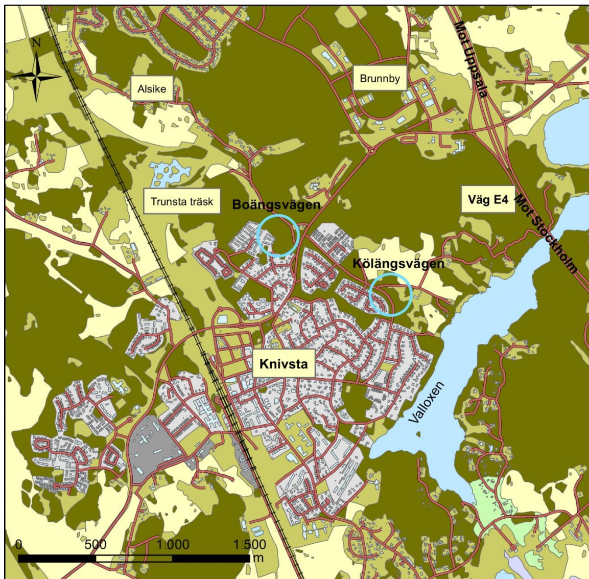
Figur 1. Översiktskarta över Knivsta med omgivningar och utredningsområdena vid Boängsvägen respektive Kølängsvägen markerade med blåa cirklar. Skala 1:25 000.

Fältinventeringen utfördes under början av maj, då markväxtligheten ännu inte försvårat möjligheten till en bra överblick.