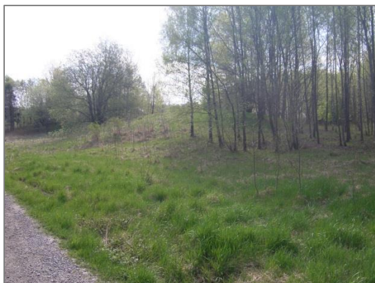
Figur 4. Foto från Kölångsvägen mot sydväst. Utredningsområdets östligaste delar var övertäckta med kraftiga jordhögar. Foto mot SV: Dan Fagerlund, Upplandsmuseet.

konstaterades också att områdets östra del, med ett i och för sig fördelaktigt boplatsläge i hagmark, delvis avsatts för flera mycket omfattande sentida jorddepåer (fig 4).