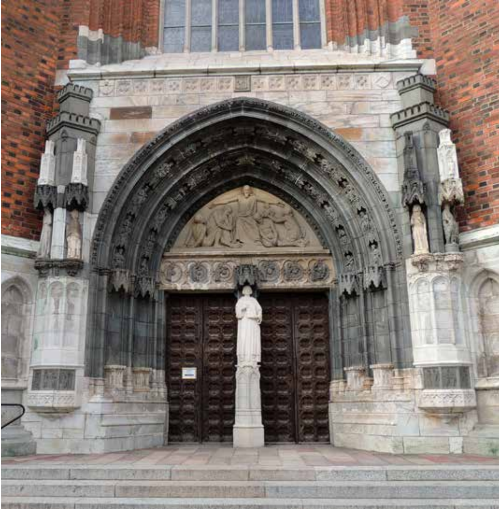
Uppsala domkyrkas södra respektive norra portal.

The southern and northern portals of Uppsala Cathedral, respectively.