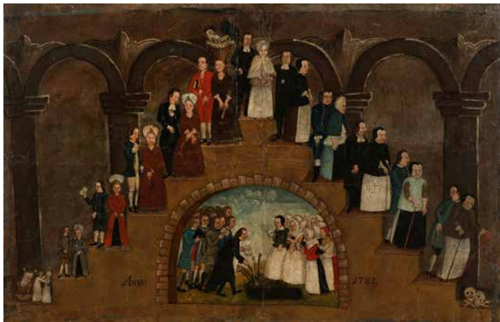
Människans åldrar med en begravningsscen i mitten. Målning av klockaren Ehrnberg i Skirö socken i Småland 1782.

"The Ages of Man" with a funeral scene in the centre. Painting by the bell ringer Ehrnberg from Skirö parish in Småland, 1782.