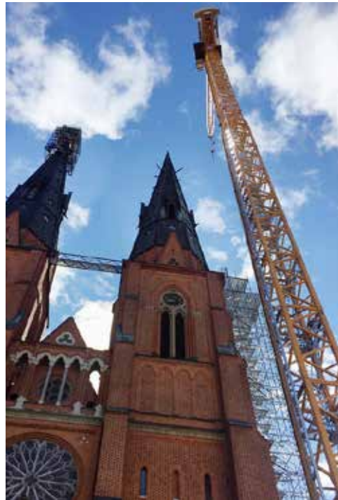
Lyftkranen som användes för att kunna restaurera domkyrkans tornkrön.

Vid de arkeologiska undersökningarna hittades också spår efter den byggnadsverksverksamhet som pågått på Domkyrkoplan åtminstone från och med att domkyrkan började uppföras på 1270-talet. En medeltida stenhuggarverkstad har