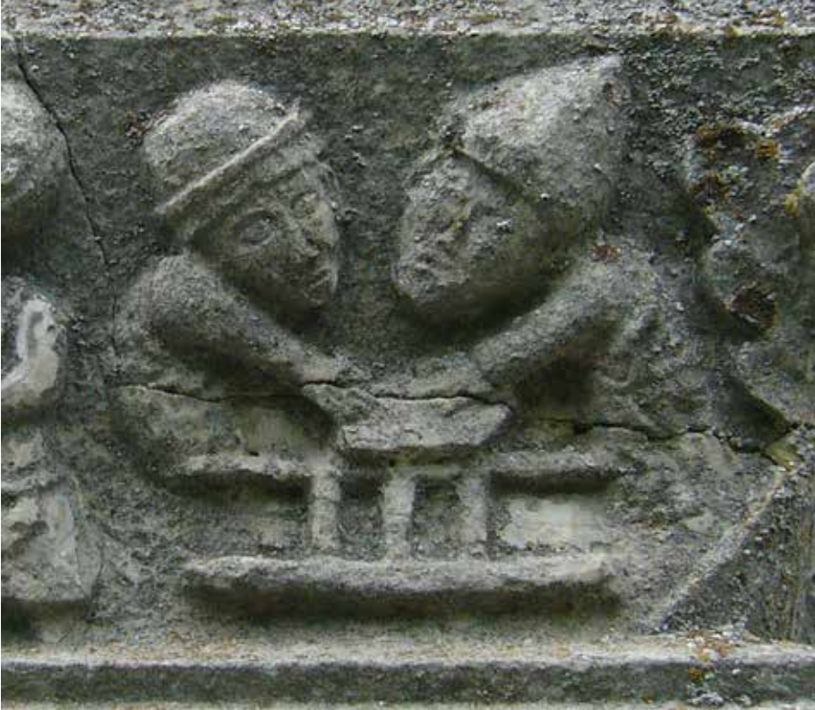
Stenarbetare transporterar block på kälke. Stensulptur från omkring 1350. Källunge kyrka, Gotland.

Stoneworkers transporting a block on a sledge. Stone sculpture from around 1350. Källunge Church, Gotland.