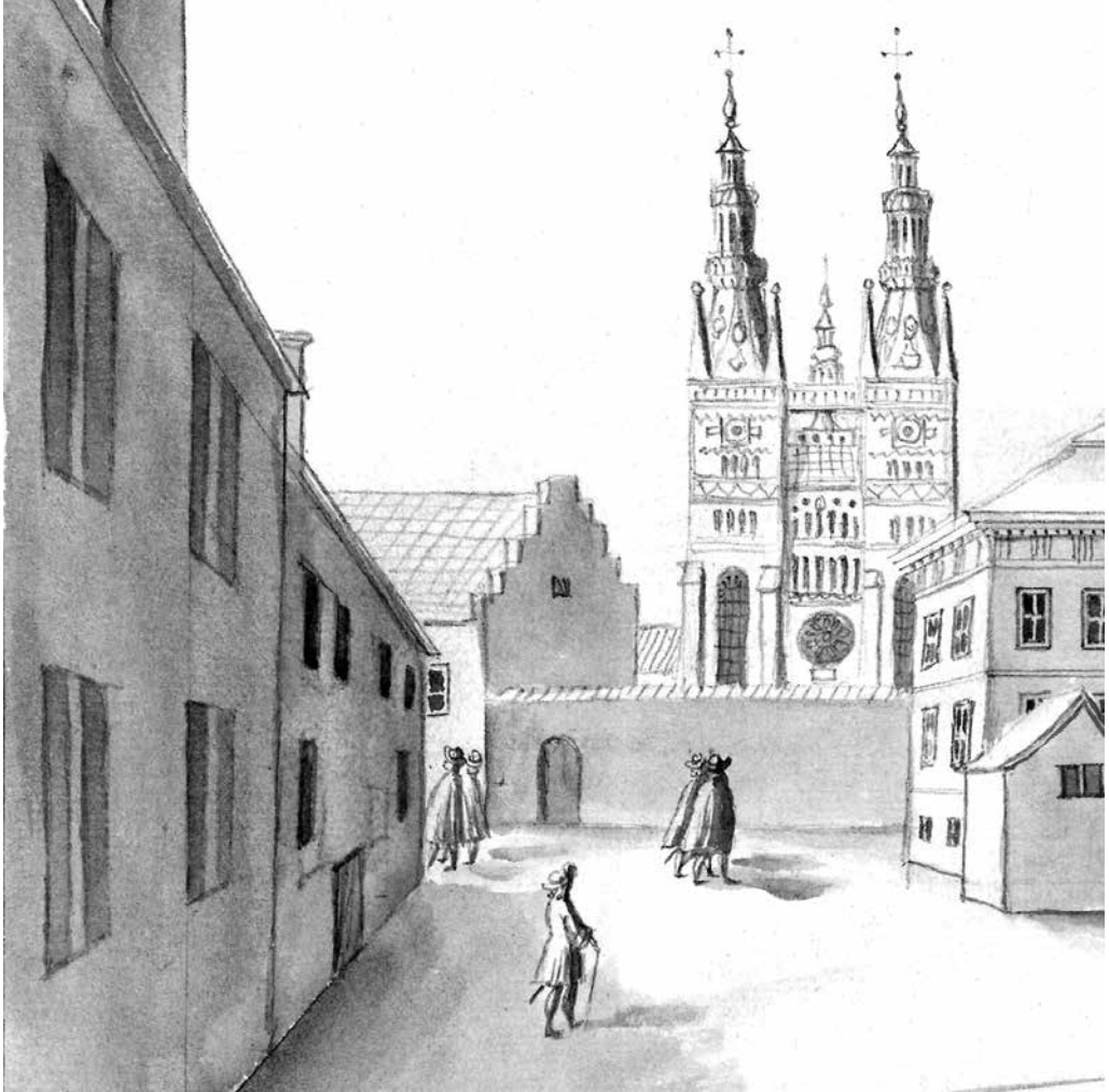
Domkyrkan från väster med omkringliggande bebyggelse. Tecknad förlaga från omkring 1690 till Erik Dahlberghs Suecia antiqua et hodierna .

Uppsala Cathedral from the west, c. 1690. Original drawing for Erik Dahlbergh's Suecia antiqua et hodierna.