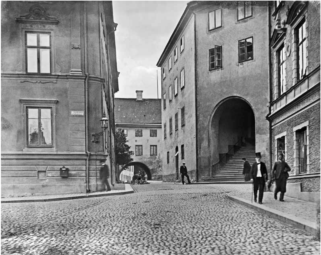
Domtrappan i det medeltida Domtrapphuset, sett från Fyrstorg. Foto runt 1900 av Otto Janse. Riksantikvarieämbetet, Kulturmiljöbild.