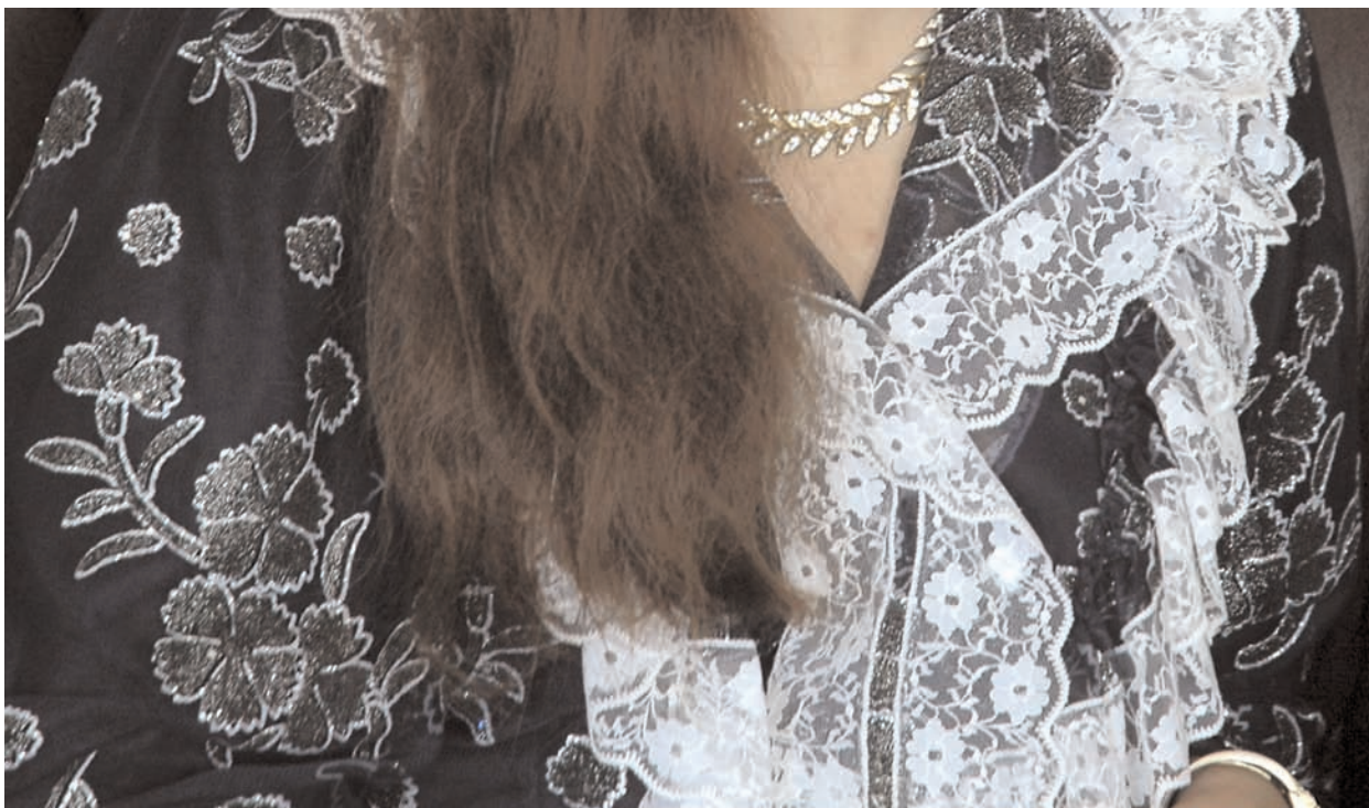
Att kunna behålla sin kulturella särprägel är inte bara möjligt, utan även önskvärt i de offentliga skrivningarna. Vem ska bära upp det särpräglade? Finsk-romsk kvinnas klädsel.

motverkas? Frågan är inte helt olik den debatt som förts i Frankrike om muslimska kvinnors rätt att bära slöja, en diskussion som bl.a. Okin refererar till. Frågan är om man ska acceptera en religiös och kulturell klädsel i mångkulturens namn och betrakta försök att motverka den som kulturell imperialism, eller om man ska ta avstånd från det av kvinnoemancipatoriska skäl.