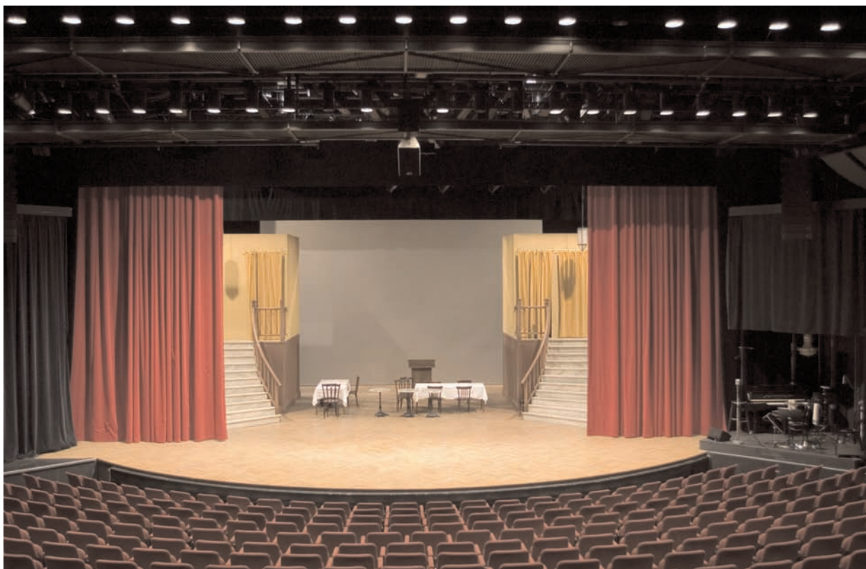
Vem påverkar utbudet på kulturens scener? Uppsala stadsteaters stora scen.

och lyssna på främmande musik. Men man vill inte ha folk från andra kulturer som arbetskamrater av olika skäl. Så man kan nog inte säga att Sverige är mångkulturellt ännu i alla fall. Det kanske blir om hundra år. Men ett mångkulturellt samhälle det måste man väl ändå säga att det är ett ganska tillåtande samhälle där man kan stå ut med olikheter. Alla sorters olikheter. Och det kanske inte bara är de etniska svenskarna som måste jobba på det, utan det finns nog saker som man måste fundera på när man kommer hit också.