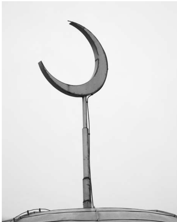
Jämbördiga symboler? S:t Lars kyrka och Uppsala moské.

vara de invandrades skyldighet att anpassa sitt familjeliv och boende efter normaliserade svenska förhållanden: